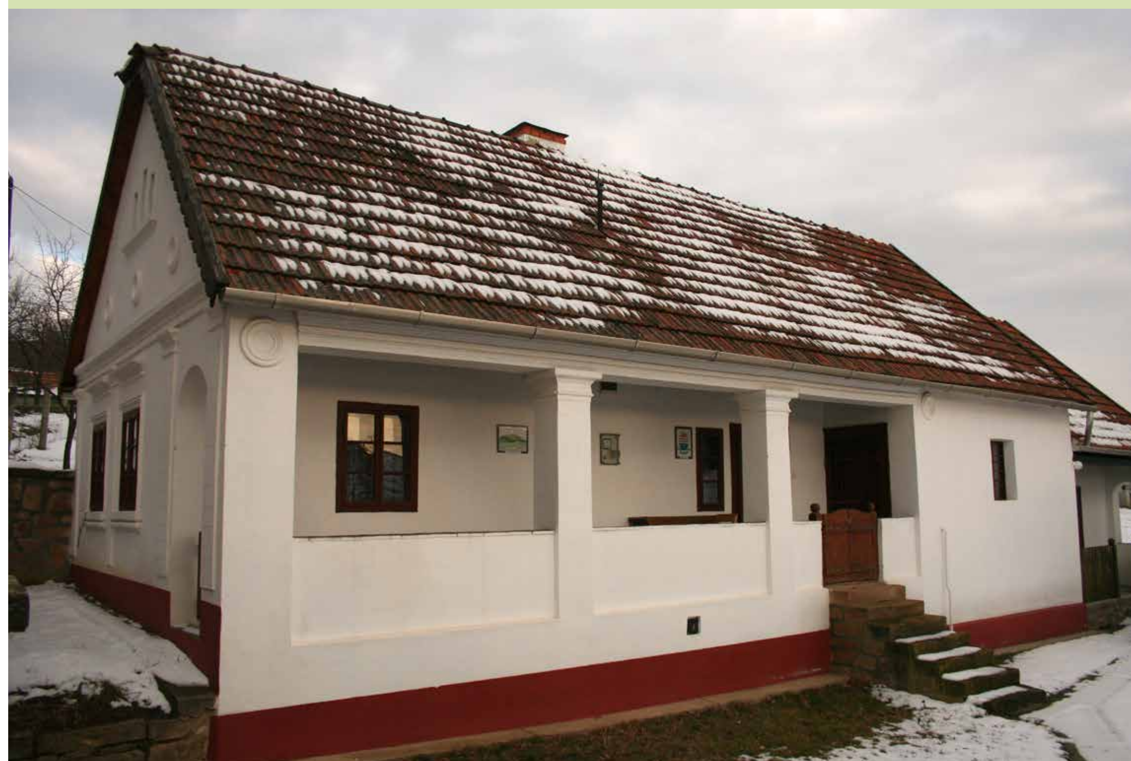
Kiállítások helyszíne a Községi Emlékház

A község felett emelkedő Hódos ormára egy különös természeti képződmény, a Patkó-sziklák vonzza tekintetünket. A mintegy 100 méter átmérőjű, körbe foglalható sziklás képződmény a népi legenda szerint Szent László király lovának patkónyomát őrzi.