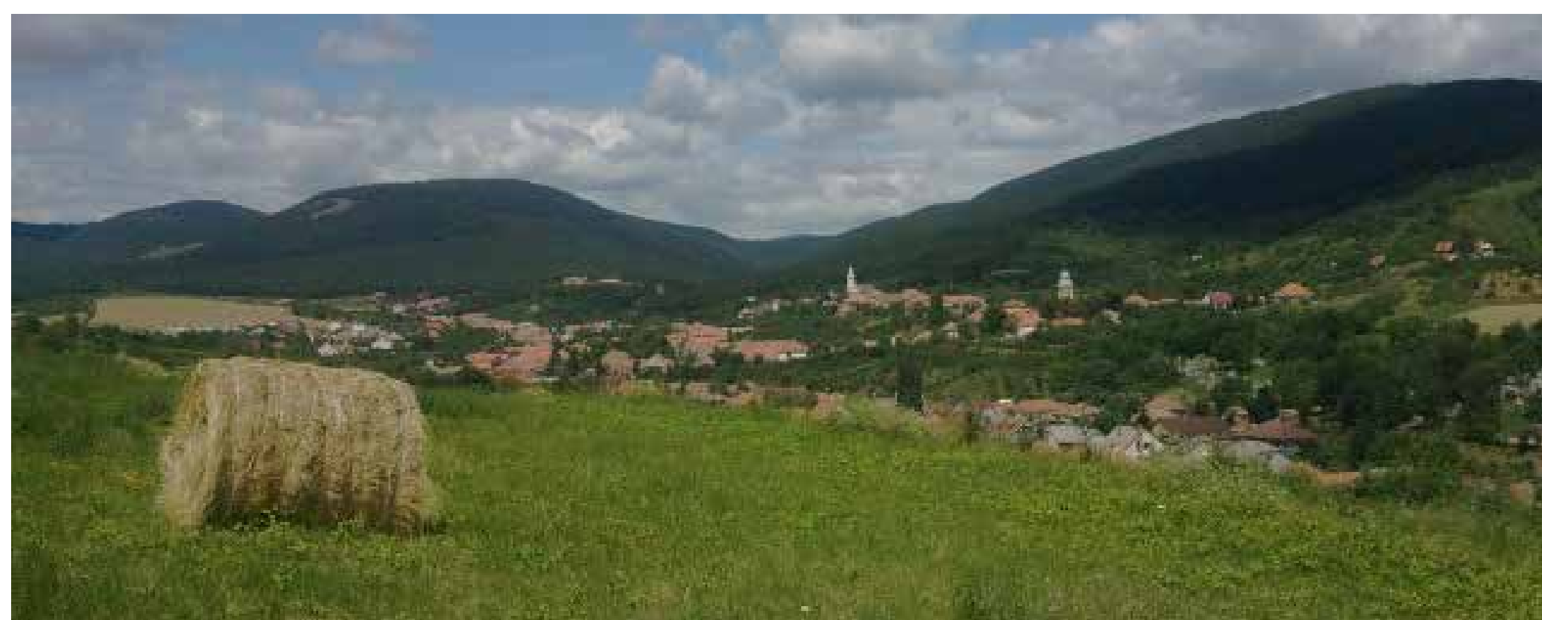
Bükkzsérc látképe az Alsó-hegyről

Itt tekinthető meg a falu 1890-1970 közötti életét bemutató fotókiállítás, továbbá vadászati trófeák, és a Hajnóczy-cseppkőbarlang feltárásának felvételei.