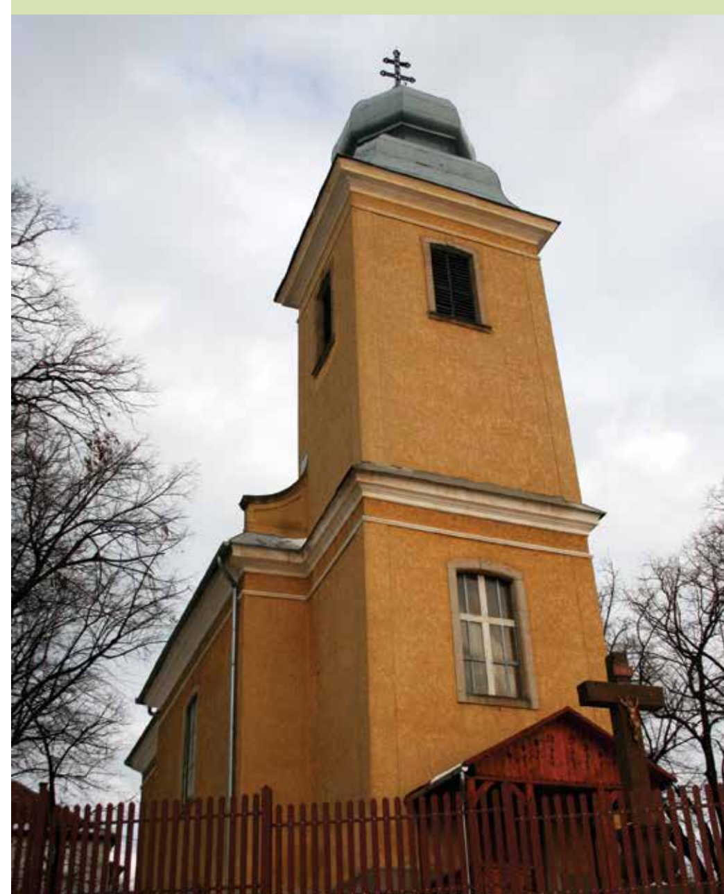
A római katolikus...

A település műemléki oltalom alatt álló, copfstílusú római katolikus templomát (titulusa: Fájdalmas Anya) Eszterházy Károly egri püspök építtette 1776–1780 között feltehetően Franz József egri építésszel. A templom oltárképe Kracker János Lukács munkája 1779-ből. A község református temploma 1828-ban épült, a tornyot 1884-ben építették hozzá.