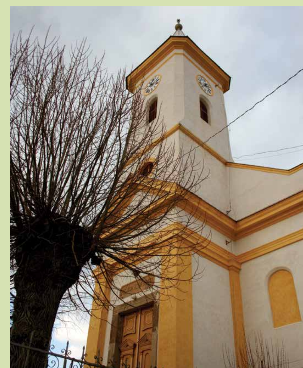
...és a református templom