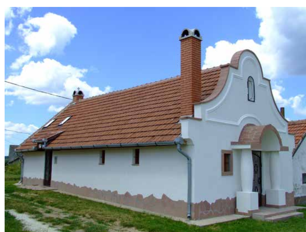
A Pelyhe Pince felújított présháza