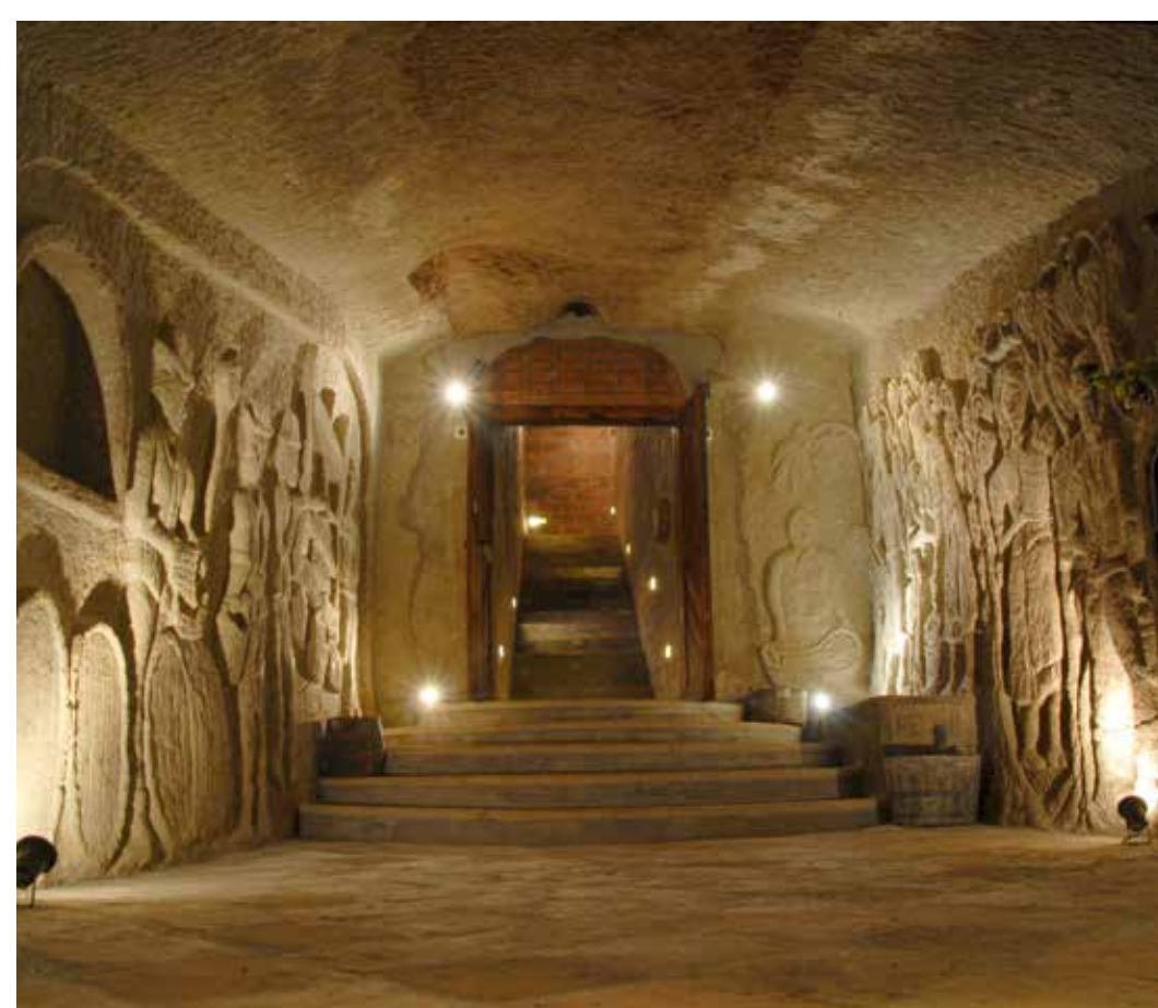
A Pelyhe Pince tufafaragásai