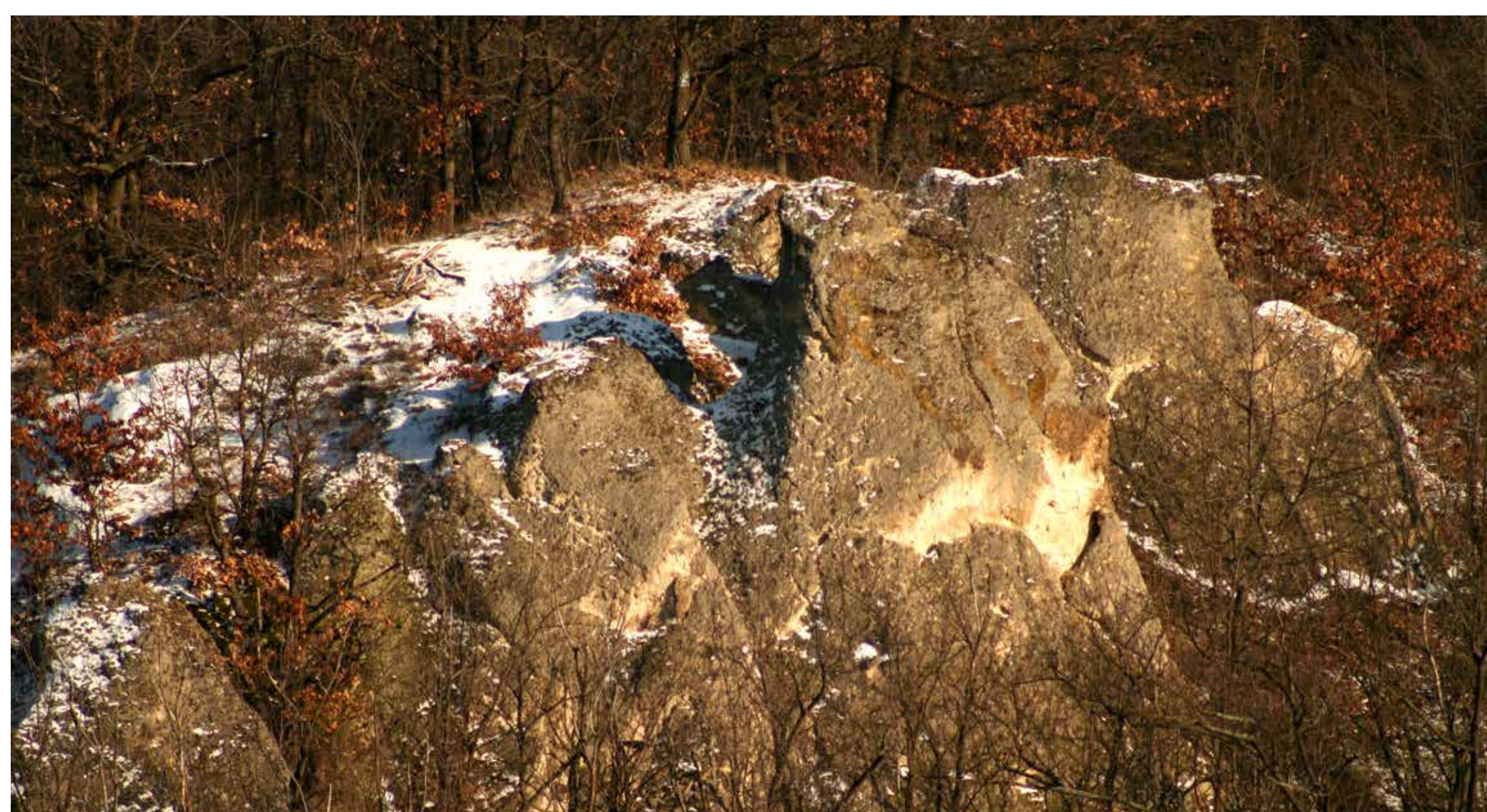
Kaptárkövek a Mész-hegy nyugati oldalában