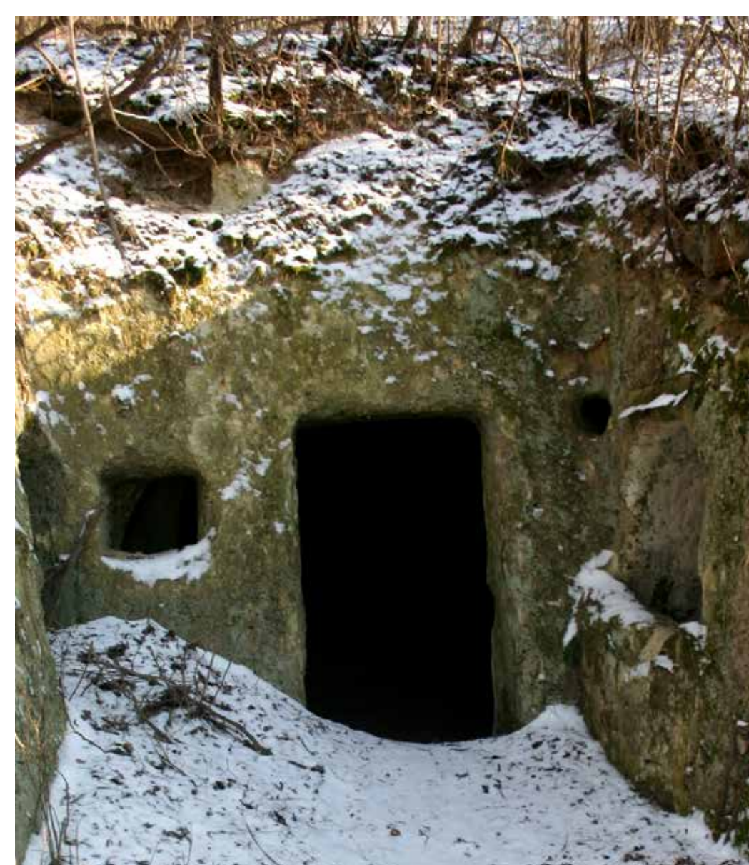
Sziklahelyiség a Mész-hegyen