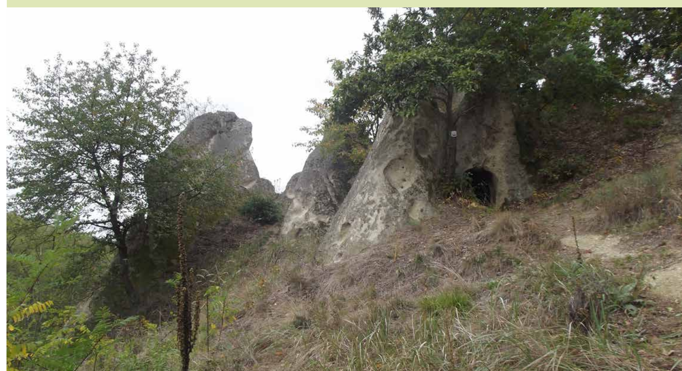
Az északi kaptárkőcsoport

lett a sziklacsoport mellett található még egy szikla, mely 4 db fülkét rejt. Mindenképp érdemes benézni a két sziklacsoport között megbújó sziklahelyiségbe is, ahol még tisztán felismerhetjük a tüzelőberendezést, a sziklafalba faragott alvópadrát és a tárolóhelyiségeket is. Ha figyelmesen járjuk a környező, sűrűn burjánzó fiatal akácerdőt, még felfedezhetjük a hajdani kultúrtáj túlélőit: öreg naspolya-, cseresznye-, dió- és almafákat, és az elvadult szőlők indáit.