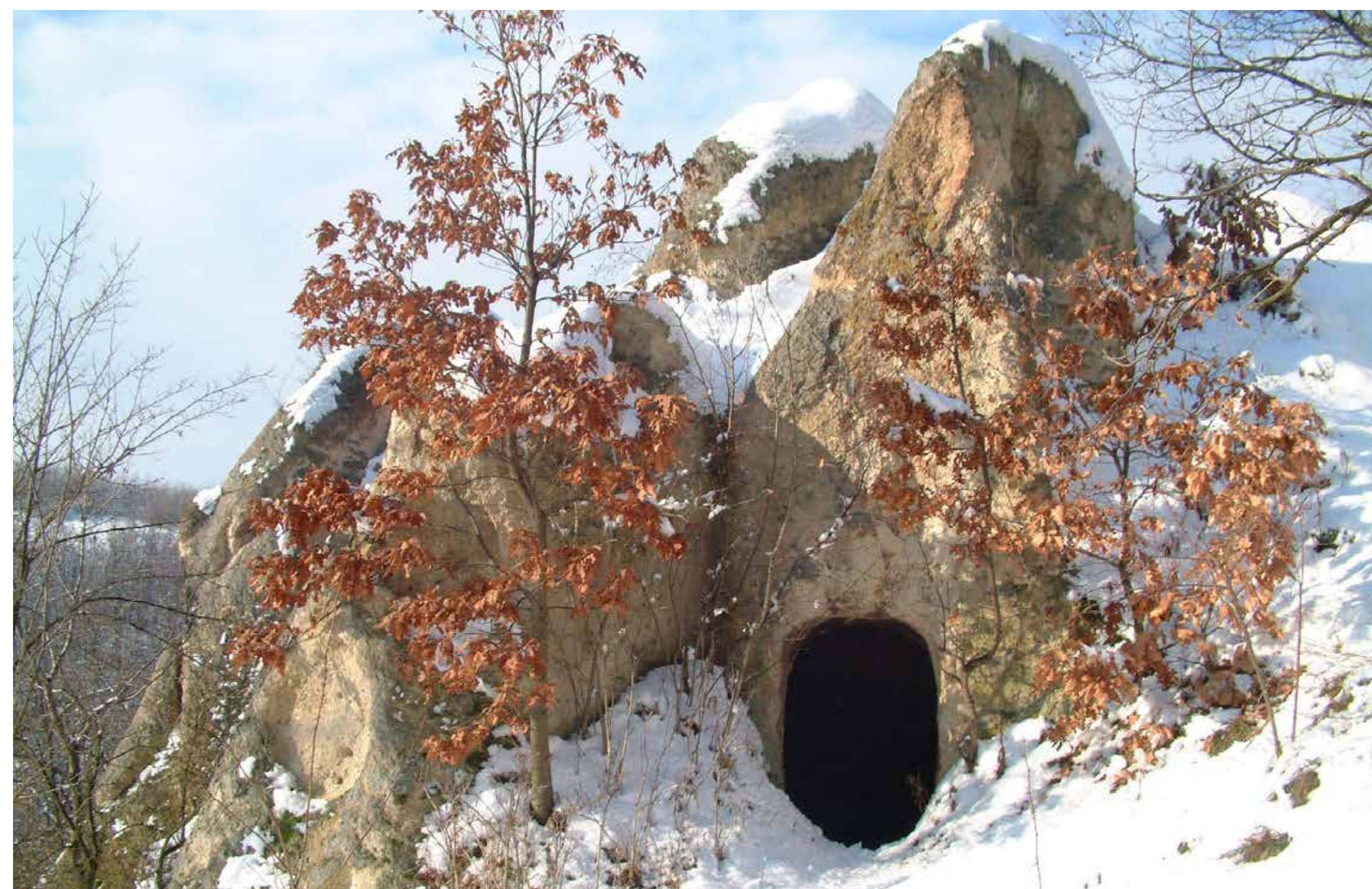
Bújó a Mész-hegyen

Több elmélet is született a fülkék rendeltetéséről: az egyik szerint sírelékek voltak, s a fülkébe az elhunytak hamvait rejtő urnákat helyezték. Egy másik elmélet a vakablakoknak bálványtartó, áldozatbemutató ren-