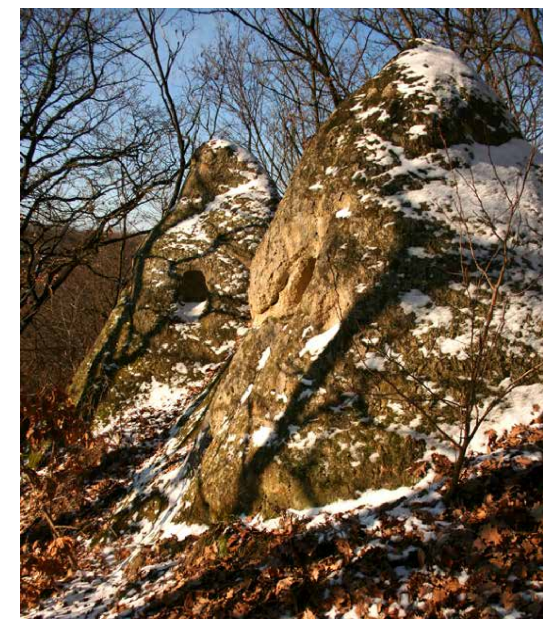
A déli kettős sziklakúp