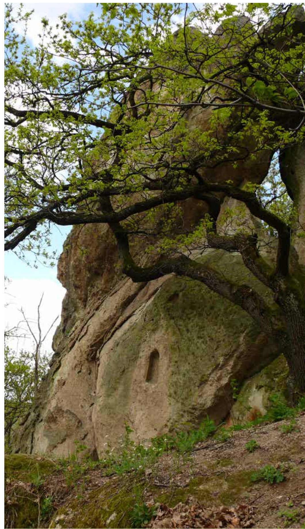
A Nyerges-hegy sziklakúpja délről

Eger délkeleti határában, a Nyerges-tető nyugati oldalán található a Bükkalja egyik legrejtélyesebb kaptárköve. A sziklavonulatról a kaptárkövek első nagy kutatója, Bartalos Gyula is megemlékezett jó száz évvel ezelőtt. A lapos ormú sziklavonulattól egy keskeny és mély hasadék választja el a helynek is nevet adó magas sziklatornyot. Ennek az impozáns riolittufa-oszlopnak a tete-