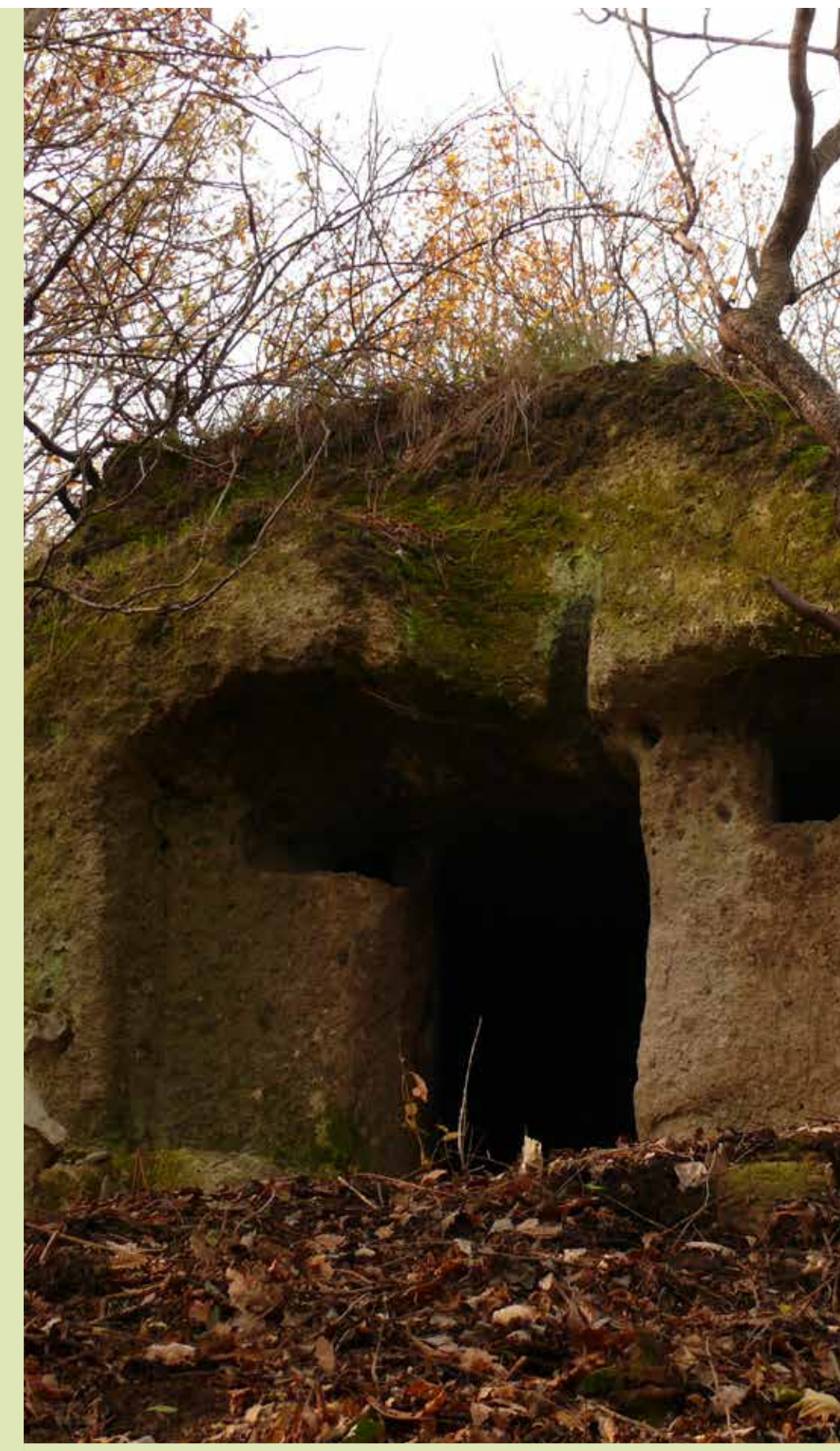
Bújó a Nyerges-tető keleti oldalán

A Nyerges-tető és a Mészhegy egykor Eger egyik legjelentősebb szőlő-gyümölcs termő dűlője volt. A domboldalakat végig gyümölcsös parcellák szabdalták, kisebb erdőfoltokkal és a parcellákat elválasztó cserjés-fás mezsgyékkel. A gyümölcsösök nagy része hagyományos művelésű, kaszált aljú gyümölcsös volt, szőlőkkel tarkítva. Számos gyümölcsfajt termesztettek a gazdák, de az igazi érték a fajtahasználatban rejlett: mindenhol régi fajtákat használtak (pl. törökbálint alma, batul alma, mézes kör-