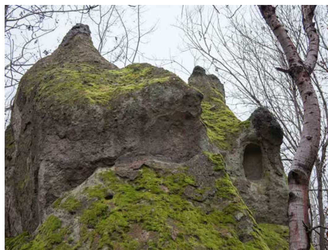
Kaptárkő a Nyerges-tető keleti oldalán

A Nyerges-tető keleti oldalán – szemben a mészhegyi kaptárkövekkel – egy kúp formájú szikla emelkedik, oldalán 7 fülkével, belsejében archaikus sziklahelyiséggel. Egyébként a környéken elég sok kőzetbe faragott szőlőkunyhó, bújó és pince található, a hajdan virágzó szőlőkultúrára emlékeztetve.