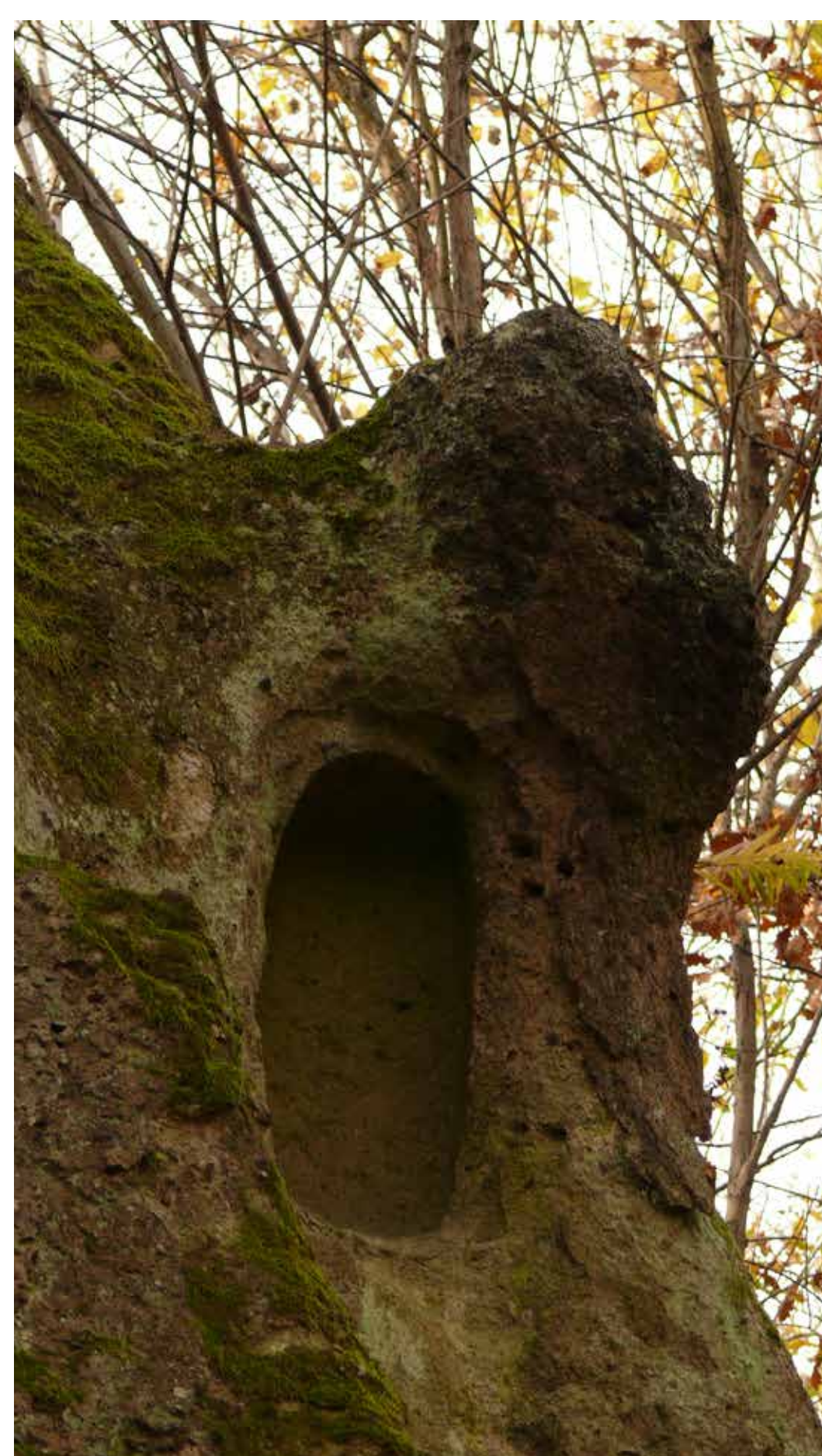
Fülke a Nyerges-tető keleti oldalán

De a szikla nemcsak különleges formájával, hanem a falába faragott fülkék méretével és alakjával is kitűnik a többi kaptárkő közül. Több épen maradt fülke különösen sekély mélységű, illetve némelyeknek a hátlapja erősen kihajlik. A sziklavonulaton összesen 24 fülke, illetve fülkenyom található, néhányuk már erősen megkopott állapotban. Másik érdekesség a főkúp sziklatornyába faragott, fél méter magas emberi alakot formáló sziklavészet, melynek rendeltetését és keletkezési korát teljes homály fedi. Említést érdemel a sziklától nyugatra az a sziklahelyiség, melynek mennyezetét ívesre képezték, és a terem nyugati falán az egykori tüzelőberendezés nyomait is felfedezhetjük.