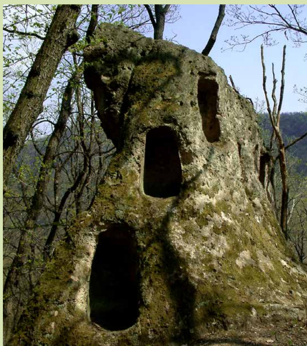
Cserépváralja - Nagy-Bábaszék

A fülkés sziklákat a szomolyai lakosok nevezték kaptárköveknek, Eger környékén vakablakos köveknek, másutt köpüsköveknek, Ördög-tornynak, Nagybábaszéknek, Nyergesnek, Hegyeskőnek, Kecsekőnek, Ablakoskőnek, Királyszekének, Kősárcánynak mondják azokat. Legismertebbé és legelterjedtebbé a kaptárkö elnevezés vált. Ezen a néven említik tanulmányaikban a kaptárkövek rejtélyének megoldásán fáradozó kutatók is.