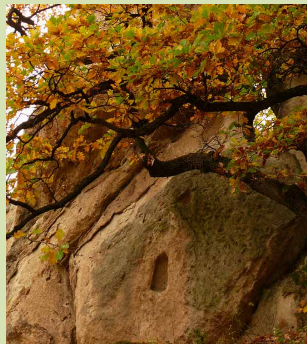
Eger - Nyerges

A legtöbb vitát a sziklaalakzatok oldalaiba vájt fülkék eredete, készítésük oka váltotta ki. Az átlagosan 60 cm magas, 30 cm széles és 25–30 cm mély fülkék peremén – az épségben lévőknél még jól láthatóan – bemélyedő keret fut körbe, széleiken néhol lyukak is kivehetők.