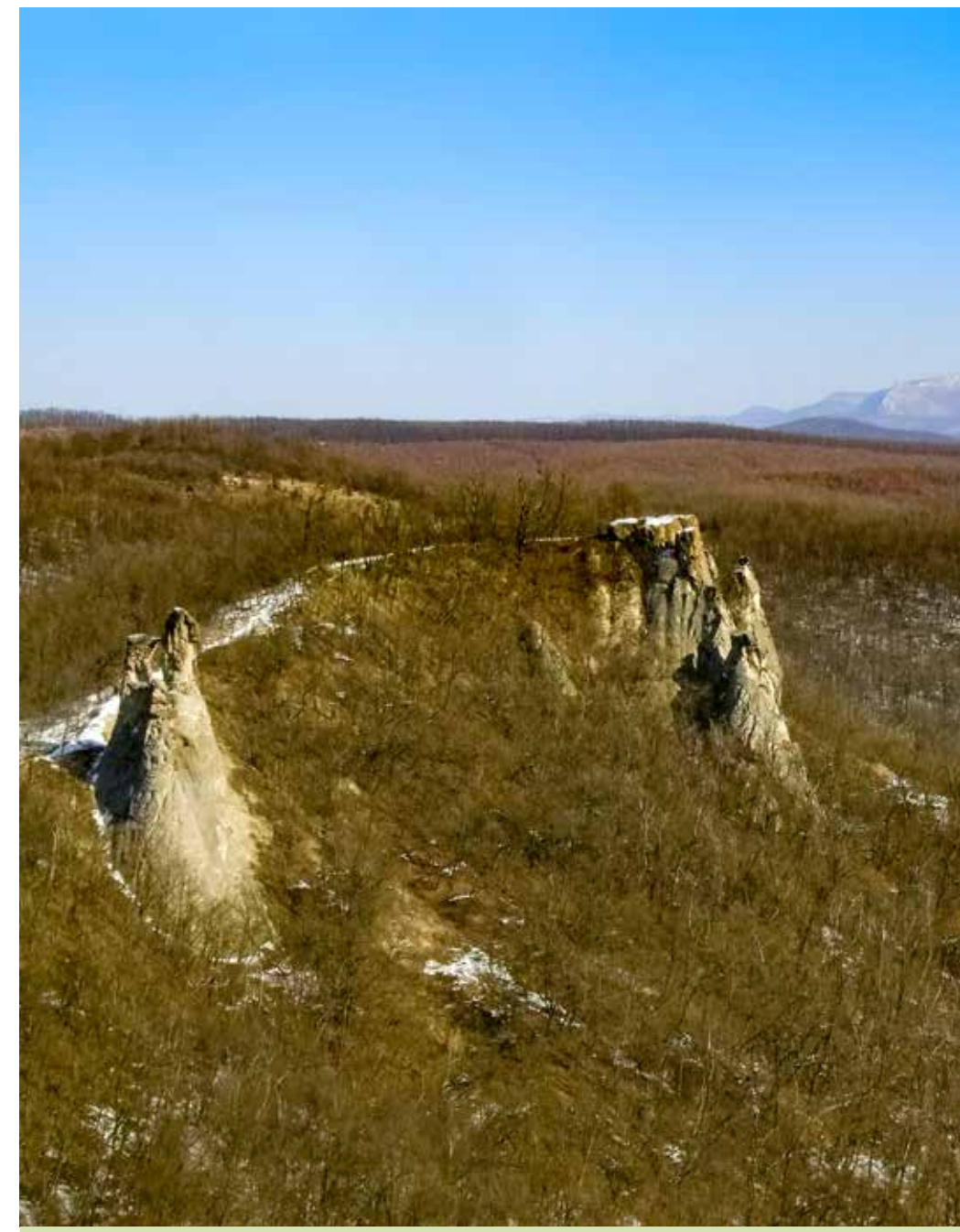
Sirok – Törökasztal

a miocén korban zajló heves vulkáni működés (explozív kitörések sorozata) hozta létre. A zömében riolitos összetételű ártufák és ignimbritek alkotta térszínből a jégkori felszínfejlődés meghatározó tényezői (a folyóvizek mélyítő és oldalazó eróziója, az aprózódás, a mállás, a szél és a csapadék leöblítő hatása) alakították ki a Bükkalja különleges kúpjait, sziklavonulatait, melyek felületét később az ember átalakította. A kaptárkövek tehát természeti értékek és egyúttal kultúrtörténeti emlékek is.