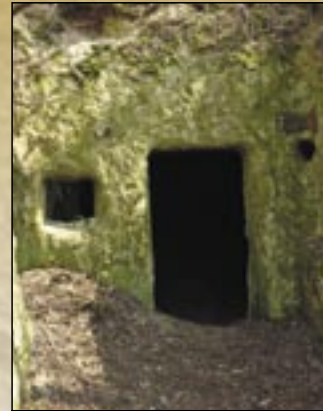
Elhagyott pince a Mész-hegyen

A XVI. században, a török fenyegetettség újabb lendületet adott a pincekészítésnek: ekkor készülhettek az Almagyar utca tágas pincéi, de ezekben az időkben vájhatták a felnémeti templomdomb pincerendszerét is, melyet Eger eleste (1596) után magyar hajdú szabadcsapatok foglaltak el, és innen zaklatták folyamatosan a várból kimerészkedő törököket. Ezt megeléggel a pasa betömette a pincéket, amelyeket csak a török kiűzése után, 1706-ban bontottak ki újra, és többségük azóta is használatban van. De itt még az 1906-ban megépülő Eger–Putnok vasútvonal tereprendezésekor is találtak befalazott pincéket, sőt, napjainkban is kerülnek elő újabb és újabb üregek. Korai keletkezésűek a Kisvölgy utca, a Szala, és a Nagyköporos préház nélküli torokpincéi is. A Nagy- és Kisköporos nevét a hajdanán az edények tisztításához használt kőporról kapta, melyet itt bányásztak.