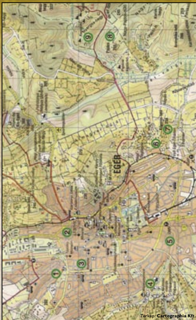
Térkép: Cartographia Kft.