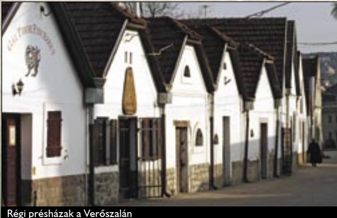
Régi préházak a Verőszalán

A XV. században az egri káptalan birtokkönyve már említést tesz a Király-szék alatti üregekről: ezek lehettek Eger legkorábbi pincéi, melyeket a mai Tetemvár utca mészfapadja, az ún. darázkő alá, a kavicsos üledékbe mélyítettek. Ezek az üregek még egyszerűek, szabálytalan belső terük követi a sziklapad hajlatait. Komolyabb pincehelyiségek csak az 1500-as évek elején készülnek, és ezek képezik a vár kazamatáinak alapját. Ezekben már bort tároltak.