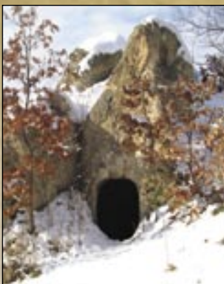
Bújó a Mész-hegy kaptárkővén

A Nyerges-hegytől délre fekszik a Pajdos, vagy Pajdosos sziklapadja, melyen 9 megkopott fülke ismerhető fel. A sziklapad nem is alakja, hanem inkább neve miatt érdemel említést: a pajod a palóc népi hitvilág hiedelménye, mely nap- illetve holdfogyatkozásakor felfalja az égtesteket.