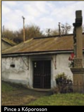
Pince a Kőporoson

Egerben a szőlő- és borkultúra egészen az Árpád-korig nyúlhat vissza, hiszen az itt megalapított egri püspökség liturgiáihoz szükséges bort valószínűleg már helyben termelhették meg. A XII. században behívott németalföldi-vallon telepesek nyugat-európai, majd a XVI. század derekán a török elől menekülő görög és szerb rácok, és az itt megtelepedő borkereskedelemmel foglalkozó cincárok balkáni és dél-európai elemekkel gazdagították az egri borkultúrát.