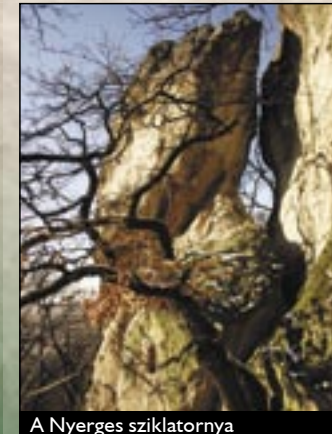
A Nyerges sziklatornya

A város déli határában, Nyerges-hegy nyugati oldalán emelkedik a Bükkalja kétségkívül egyik legszebb kaptárkőcsoportja. A sziklaképződmény egy, a hegygerincből kinyúló lapos platóból, illetve egy különálló, a sziklaplatóhoz nyereg alakú gerinccel kapcsolódó sziklatoronyból áll. A platón érdekes, tálszerűen kiképzett mélyedéseket találhatunk, melyek egyesek véleménye szerint pogány áldozati oltárként szolgálhattak, sőt, többek szerint a sziklanyereg is emberi kéz munkája. A sziklavinnyű összesen 24 emberi kéz által faragott fülke, illetve fülkenyom található, néhányuk már erősen megkopott állapotban.