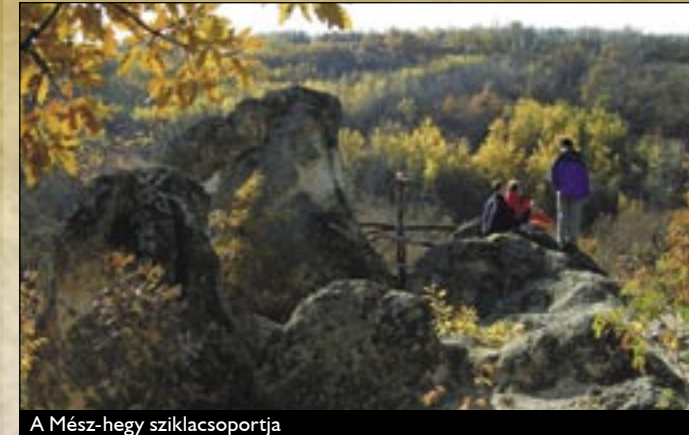
A Mész-hegy sziklacsoportja

Az 1700-as években, a török kiűzése után kezdett el kiépülni az egri érseki pincerendszer. Az Egerbe visszatérő Fenessy György püspök úgy döntött, hogy a püspökség székhelyét áthelyezi a várból a belvárosba, ezért a városban két telket vásárolt, amelyre megkezdődtek az építési munkálatok, méghozzá a hegy gyomrából kitermelt riolittufából. A kitermelt kő után hatalmas labirintusrendszer keletkezett, amely több mint 3 km hosszan nyúlt el a föld alatt a Hatvani kaputól egészen a város északi határáig, a Rác kapuig. Szükség is volt erre a hatalmas pincerendszerre, hiszen itt raktározták az egri püspökség Gyöngyöstől Munkácsig terjedő birtokairól beszedett bortizedet. Ma a pincerendszer „Város a város alatt” néven turisztikai attrakció, mely bekerült az ország 7 csodája közé.