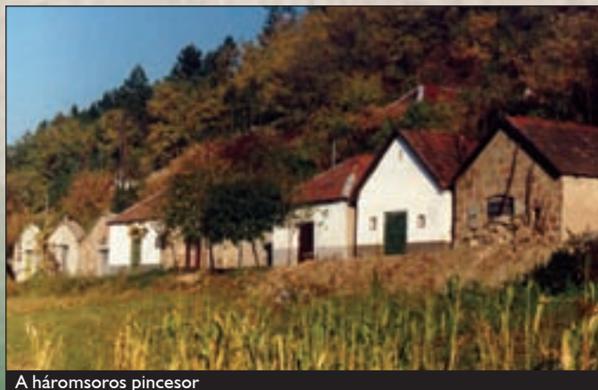
A háromsoros pincesor

Jelentősek a település környékének őskori régészeti leletei is. A falutól észak-északkeletre kb. 2 km-re emelkedő Mész-tetőn késő bronzkori, kora vaskori telep (Kyjatice-kultúra) sáncai láthatóak. A Mész-tető alatt, attól északra fekvő Hidegkút-laposa-völgyben lévő homokbányában bronzkori telepre utaló cserepeket, örlőköveket, paticsot találtak. Továbbá ebből a völgyből a népvándorlás korából származó cserepek is elkerültek. A Hór-völgy fölé kiugró egyik keskeny, sziklás gerinc végén áll egykoron az Ódorvár . Építésének és pusztulásának ideje és körülményei ismeretlenek, egyetlen okleveles említése 1351-ből való. A váralapozás a déli oldalon, hosszú szakaszon még ma is áll. A romokról csodálatos kilátás nyílik a Dél-Bükk hegláncaira, a Bükkalja dombsoraira, falvaira. A vár oldalában 494 méteres tengerszint feletti magasságban nyílik az 1971-ben bontással feltárt Hajnóczy-barlang . A cseppkövekben igen gazdag barlangot 1982-ben fokozott védelem alá helyezték. Csak engedéllyel és megfelelő felszereléssel látogatható. A Hór-völgy Ódorvár alatt elterülő tisztásán áll az Oszlaji tájház , ahol az erdőt gondozó erdészek sajátos életét, tevékenységét, a mindennapos használati eszközeiket ismerhetjük meg.