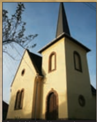
Cserépfalvai katolikus templom...