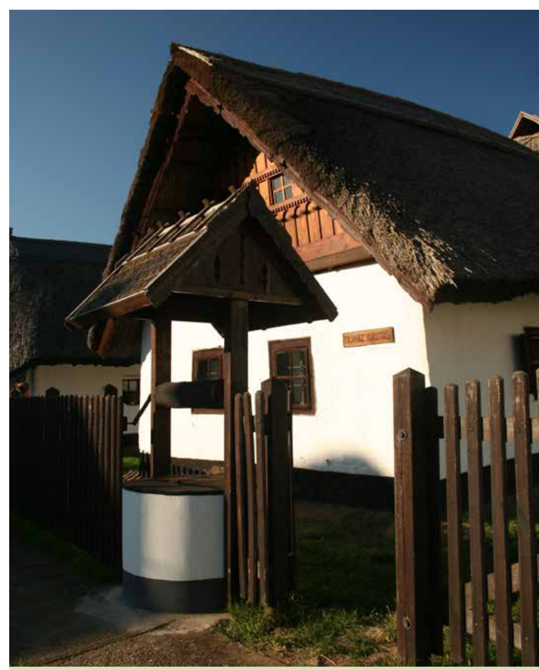
A Tardi tájház

A vidék jellemző tetőszerkezete az ágasfás-szelemenes. Ennek egy sajátos változata az általánosan matyónak minősített üstökös- vagy buggyos tető. Üstökös háznak nevezik a zsúppal vagy náddal lefedett ház végfalainak félkúp alakú fedését. Készítésekor az épület oromzatánál a szelemenbe egy 2 m hosszú él-szarufát csapoltak, és erre fektették rá a tető meghosszabbítását, a „buggyot”. Ez alatt a széles eresz alatt aztán esőben kényelmesen lehetett pipázgatni, de ide kerültek a gabonásvermek is. A szelemenes tetőszerkezet lényege, hogy az orom alatt végigfutó gerenda (szelemen) tartja a tető súlyát, és ezzel mentesíti a falakat az oldalirányú nyomástól.