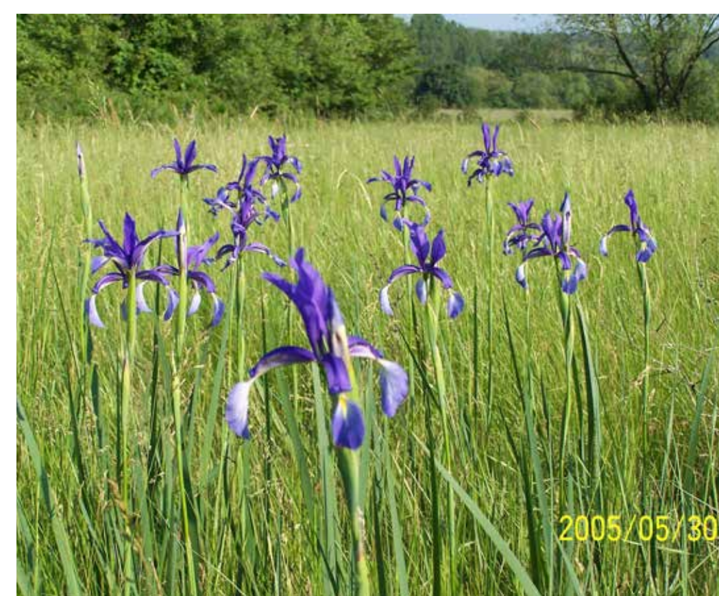
Mocsárrét a Tardi-legelőn

területével. A terület védelmének fő célkitűzése a területen található természetes mocsárrét és löszvegetáció (löszgyepek, cserjések, lösztölgyes fragmentumok), illetve az ott élő védett és fokozottan védett flóra- és faunaelemek élőhelyeinek fenntartása. A Bükki Nemzeti Park Igazgatóság vagyonkezelésében lévő terüle-