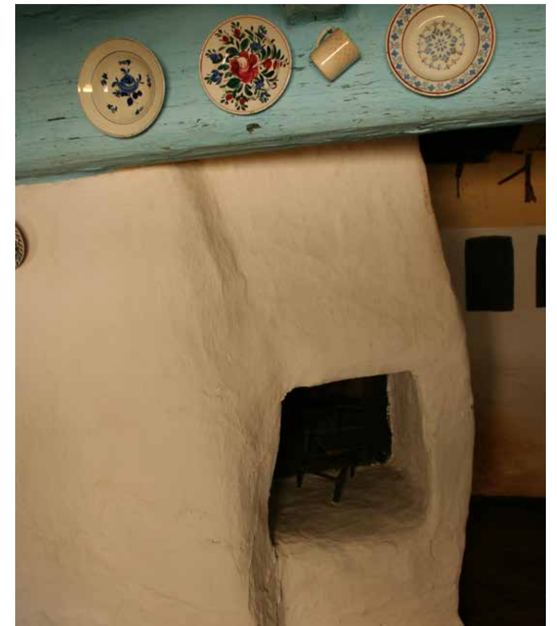
Tapasztott sütökemence a tájház konyhájában, a „pitvarban”