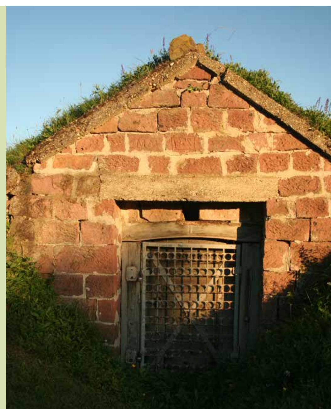
Pincebejárat a Sándori-pincesoron

Egyedi építészeti emléket képviselnek a fejtett, rózsaszín riolitignimbitből rakott oromzatú, kis csoportokba, utcákba rendeződő pincék, melyek a falu határában több felé megtalálhatóak. Érdeemes kilátogatni a pincesorokra, ahol megkóstolhatjuk a gazdák helyi borkülönlegességeit.