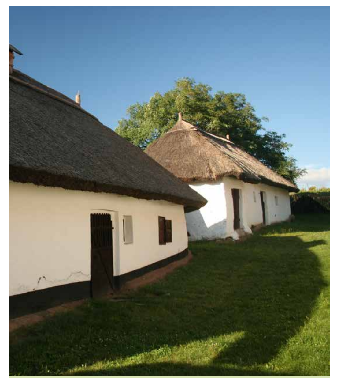
Gazdasági épületek a tájház udvarán