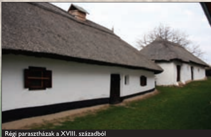
Régi parasztházak a XVIII. századból

A falu a három tipikus matyó település (Mezőkövesd, Szentistván, Tard) egyike, bár a másik két településtől számos vonásában eltér, műveltségében igen sok egyéni jegyet hordoz.