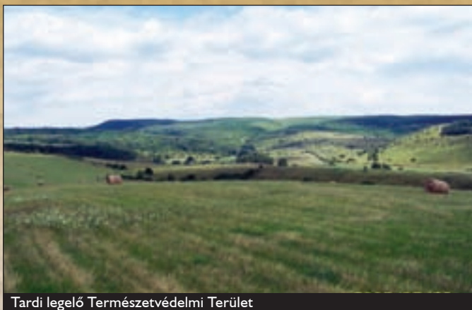
Tardi legelő Természetvédelmi Terület

Hímzészvilága és épített hagyományai híresek. A régmúlt paraszti élet emlékeit az eredeti állapotában megőrzött és berendezett nádtetős tájházak őrzik, melyek szomszédságában hagyomány-őrző rendezvényközpont működik. A Béke út 55. és 57. szám alatti , műemléki oltalom alatt álló házak a XVIII. század népi építészetét, népi életét, a népi élet eszközeit, a tardi matyóság népviseletét mutatják be.