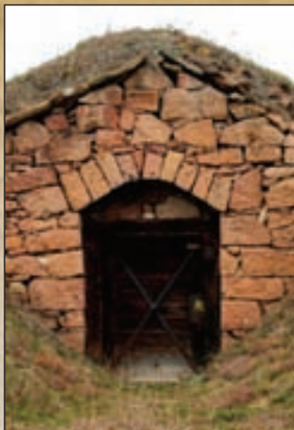
Pince a Sándor-völgyben

ság vagyongazdálkodásban lévő területen a legelőkön hagyományos birkával történő extenzív legeltetés valósul meg, míg a völgytalpi részek mocsárrétjeinek természeti állapotát a rendszeres kaszálás tartja fenn. Sajátos élőhelyet jelentenek a Pokol-oldal extenzív gyümölcsösei, melyek számos értékes fajnak nyújtanak kedvező élőhelyet.