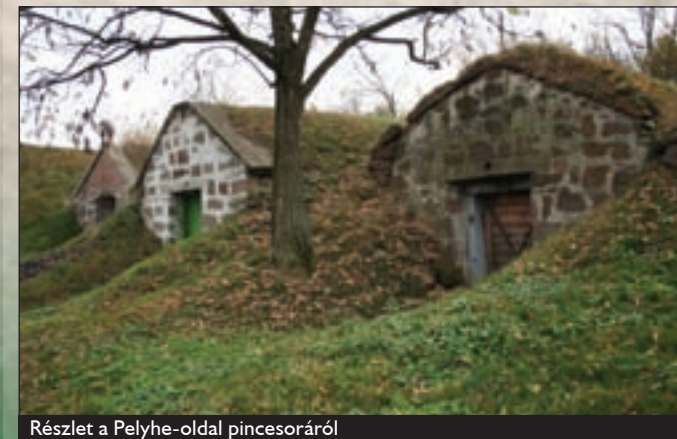
Részlet a Pelyhe-oldal pincesoráról

A Tardtól északra elhelyezkedő gyepterületek (Bála-völgy, Meggyes-oldal) Tardi legelő Természetvédelmi Terület néven kerültek védetté nyilvánításra 2007-ben, mintegy 280 hektáros kiterjedésben. A terület közvetlenül érintkezik a nemzeti park fokozottan védett Kő-völgyi területéhez. A terület védelmének fő célkitűzése a területen található természetes mocsárrét és löszvegetáció (löszgyepek, cserjések, lösztölgyes fragmentumok), illetve az ott élő védett és fokozottan védett flóra és faunaelemek élőhelyeinek fenntartása. A Bükki Nemzeti Park Igazgató-