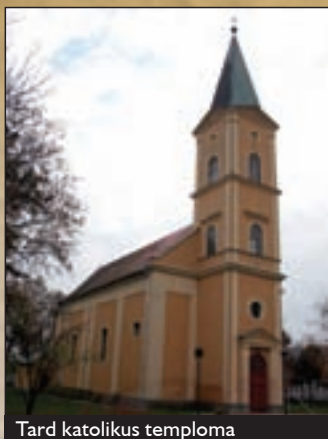
Tard katolikus temploma

Tard Egertől 22 km-re keletre a Bükkalján fekszik. A település első írásos említése 1220-ban történik Thord néven a Várad Regestrumban, de feltételezhető, hogy már korábban lakott hely volt, erről tanúskodnak a Tatár-dombon talált kora bronzkori, hatvani kultúrába tartozó régészeti leletek. Tard a XIV. században Diósgyőrhöz, majd Cserép várához tartozott, s mindkét esetben a királyné birtoka volt. A XVI. században