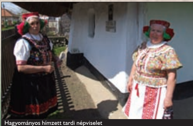
Hagyományos hímzett tardi népviselet

A falu másik híres lakosa Telepy György színész, színházi festő és író. 1837-től a Nemzeti Színház megnyitásától kezdve annak tagja,