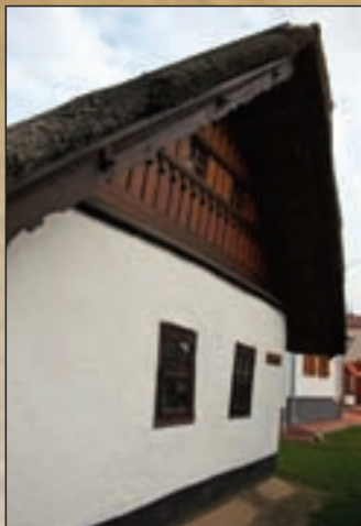
Tardi tájház díszített oromzata