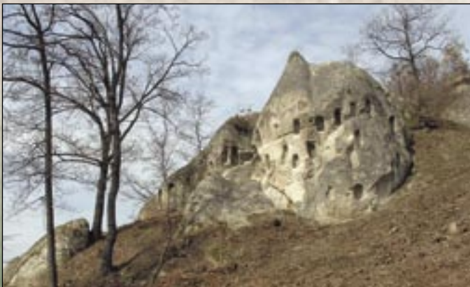
Stożek skalny w miejscu nazywanym Tron Króla (Királyszék) na zachodniej stronie Góry Starej (Vén-hegy)

li wioskę i zobowiązali jej mieszkańców do płacenia podatku. Ze względu na jej położenie geograficzne ani walki tureckiego okresu, ani walki za czasów kuruców nie wyrządziły dużych strat wiosce. (Kurucowie to uczestnicy antyfeudalnych i wyzwolńczych powstań chłopskich na Węgrzech.) Wioska przybrała nazwę Gömbösfalva na cześć dawnego ministra Gömbös Gyula po jego śmierci w roku 1937, i do roku 1945 pod tą nazwą figurowała na dawnych mapach. Szomolya w latach 1930 była kwitnącym osiedlem a jej czereśnie szomolyańskie (szomolyai cseresznye) miały duży rynek zbytu za granicą. W wiosce na głównym rynku stojący posąg Gömbös Gyula został wywieziony z Szomolyi po roku 1945 w nieznane miejsce. Niektórzy ludzie tak mówią, że go zakopano i do dziś jest w wiosce. Nikt nie zna prawdy.