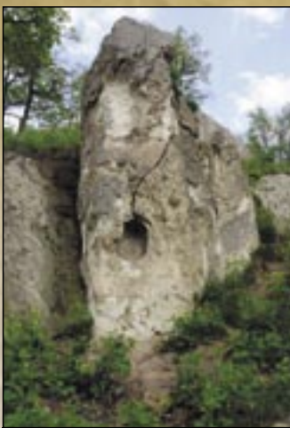
Kamienne ule w zboczu Góry Starej (Vén-hegy)

na jednym największym stożku tufy na tak zwanym Tronie Króla (Királyszék) na jednym bloku skały można naliczyć 48 nisz. Na obszarze kamiennych uli w 1958 roku otworzono kamieniołom, potem wielu ludzi zabrało głos w sprawie uratowania grupy kamiennych uli zalecając ich ochronę. Chociaż po tym władze rady komitatu zakazały wydobywania kamienia, ale do tego czasu spowodowało ono znaczne szkody. W roku 1960 wreszcie unormowuje się sytuacja wartości natury i pamiątek historii kultury: Krajowa Rada Ochrony Przyrody ogłosiła pasmo skal obszarem znajdującym się pod ochroną przyrody.