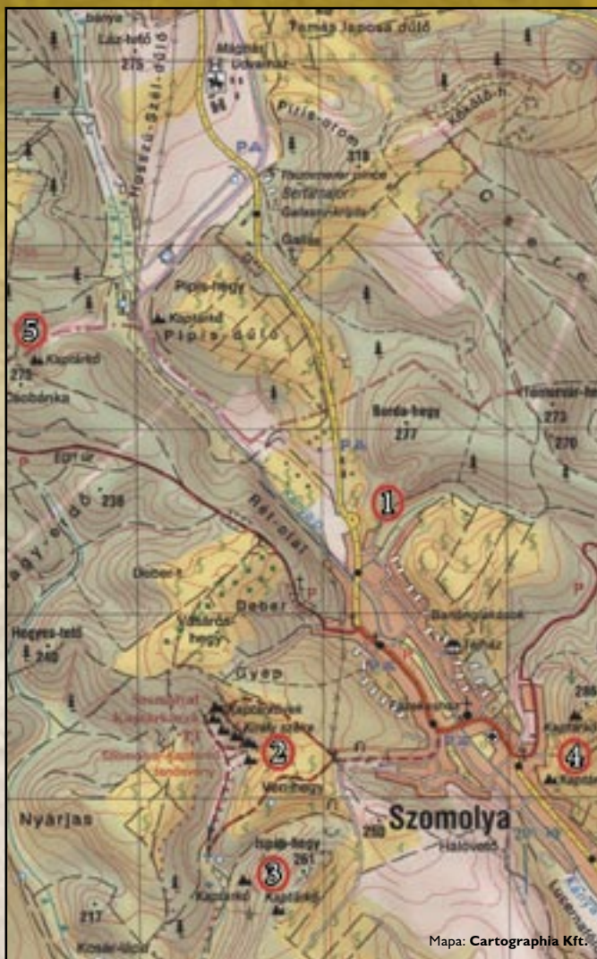
Mapa: Cartographia Kft.

Urząd Burmistrza; Adres: Szomolya, Szabadság tér 1. Tel.: +36 49/526-000 • www.szomolya.net