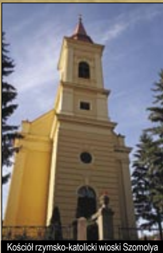
Kościół rzymsko-katolicki wioski Szomolya

Szomolya leży na wschód od Egeru, u podnóża Gór Bukowych w dolinie potoku Kani (Kánya). Pierwsze wzmianki o osadzie pochodzą z aktu darowizny z roku 1269. Osada wtedy jeszcze miało nazwę z przydomkiem: Ighazoszumula. Już w XIII wieku składała się z dwóch części: Egyházasszomolya i Felsőszomolya. Kartuzjański przeor klasztoru w Felsőtárkány kupił wioskę Felsőszomolya w roku 1486. Wioska miała kilku właścicieli spomiędzy nich przez długi czas należała do egerskiej kapituły, która jeszcze i w roku 1935 posiadała 1208 morgów katastralnych. Turcy zrujnowa-