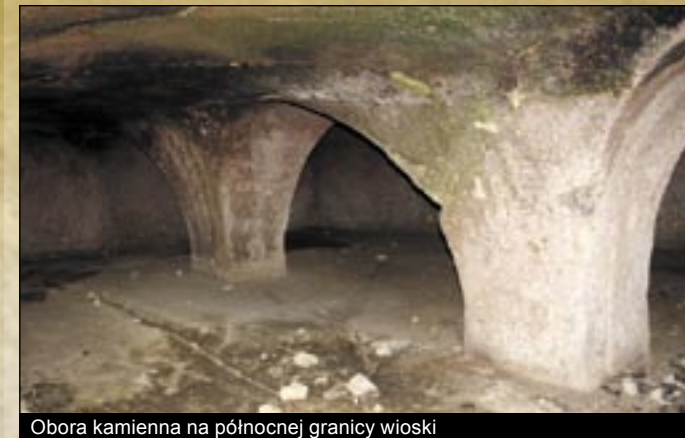
Obora kamienna na północnej granicy wioski

Pod koniec swojego życia już jako niewidomy wydrążył w piwnicy dwie cele kamienne. W jednej widać małej ołtarz z Chrystusem i Marią. W drugiej celi kamiennej znajduje się łóżko rzeźbione z kamienia. Koniec swojego życia spędził tutaj po utracie wzroku całkiem w odosobnieniu.