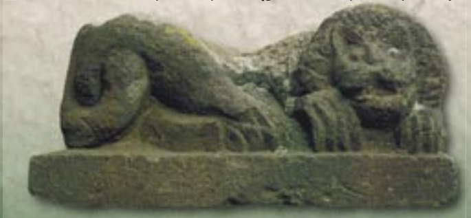
Rzeźbiony kamienne lew – dzieło Szalóki'ego Mártona

Na granicy wioski Szomolya w czterech miejscach na 13 kamiennych ulach ogółem jest 137 kamiennych nisy. Na zachód osady na zboczu wznoszącej się Góry Starej (Vén-hegy), na zboczu pagórka nad łąką Ul (Kaptár) ciągnie się większe pasmo tufy riolitowej, które jest podzielone na 8 kamiennych uli mających kształt stożka, gdzie ogólnie możemy naliczyć 117 kamiennych nisy. W tej stronie doliny występuje jedna piąta wszystkich kamiennych nisy na Węgrzech. Na tym samym miejscu