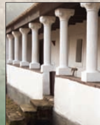
Tájház tornácának oszlopsora

Szintén műemléki védettségű a Széchenyi I. u. 38. szám alatti fésűs beépítésű, nyeregterős lakóház. Az oromzatán szoborfülkébe helyezett kisméretű Jézus-szobor, valamint Mária és József színezett domborművei láthatóak. A falazott mellvédű