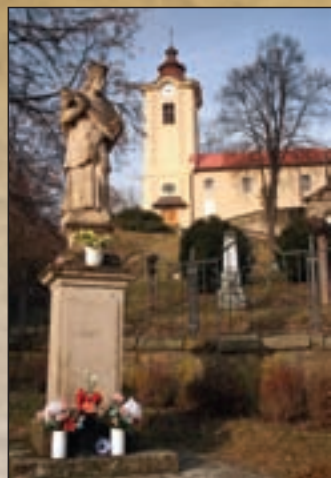
Nepomuki Szent János szobra

Sirok Egertől 20 km-re nyugatra, a Mátra északkeleti határán, a Tarna-patak (parádi Tarna) és Tarna folyó (ceredi Tarna) összefolyásánál található völgyben fekszik. A település az Aba nemzetség birtoka volt, első írásos említése 1302-ben történik Sirák névalakban. A mai település határában 294 méteres tengerszint feletti magasságban emelkedik az a sziklás riolittufa-kúp, amelyre a tatárjárás után a Siroki vár épült. A vár alatt keletkezett Sirokhalja nevű falu 1426-ban már meg-