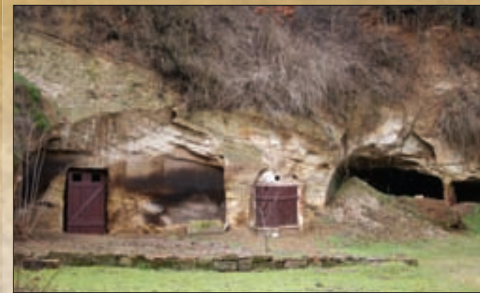
Sziklábába vájt gazdasági épületek

A falu barokk római katolikus templomát 1757-ben emelték a vár alatti dombtetőn (titulusa: Szeplőtelen Fogantatás). Az 1332. évi pápai tizedjegyzék szerint plébánia, következésképpen templom is állt ezen a helyen. Erről tanúskodnak a vár sarokbástyájába beépített románkori templomkövek. A templom előtt Nepomuki