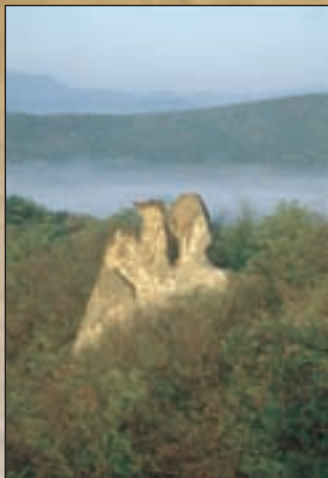
Barát és Apáca sziklák

tornácot faragott kőoszlopok szegélyezik.