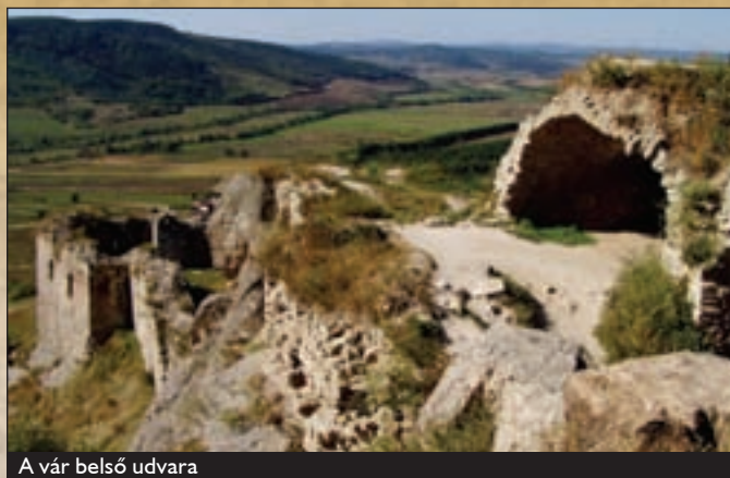
A vár belső udvara

A vár tetejéről jól látható egy asztalszerűen megfaragott dácittufatömb, a Törökaszta . Tetejébe vájt tál alakú mélyedések, csatornák, lyukak rendeltetésére, a Szent István korabeli keresztény térítések előtti magyar ősvallás áldozati szertartásai utalhatnak. A Törökaszta közelében két magányos sziklát pillanthatunk meg, melyeknek a köznyelv igen találóan a Barát és az Apáca sziklák neveket adta, mely utal a természet évezredes munkája nyomán kialakult formájukra, de a köréjük szövődött legendára is: „Darnó király borzasztó esküjének engedve – miszerint Attila hun fejedelem által csalfa módon elrabolt nejeért halállal lakoltat minden földi halandót, ki várához közeledik – Tarna lányába szerelmes Bodony vitézt nyílával lelötte. Tarna azonban Bodony vitéz elé ugrott, s a nyilvessző mindkét szívet átjárta. Bűvös nyíl volt, mely rögtön kővé dermedtette a szerelmespárt.”