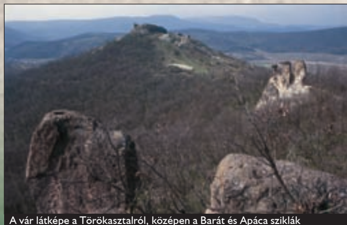
A vár látképe a Törökasztraljáról, középen a Barát és Apáca sziklák

volt, s a XV. században már mezővárosi rangot kapott. Eger eleste után 1596-ban a vár őrsege elmenekült, így a török csapatok harc nélkül foglalhatták el. A várban és a várfalak mentén törökök telepedtek le, míg a falu, Sirokhalja a XVII. század közepéig magyar földesurak birtokában maradt. Amikor Doria János tábornok 1687-ben Eger várát ostrom alá vette, a siroki vár török őrsege a várból kivonult, hogy az egri védők segítségére legyen. A hadi jelentőségét veszített és rongált állapotban hátrahagyott vár 1693-ban Bagni márki birtoka lett, aki rendbe hozatta és császári őrseggel látta el. A Rákóczi-szabadságharc alatt a vár hadi szerepet nem játszott, ennek ellenére 1713-ban a császáriak felrobbantották. A várrom ma műemléki védelem alatt áll.