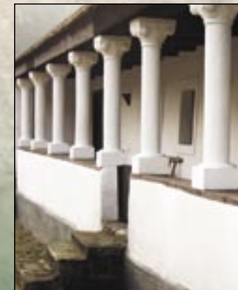
Rząd słupów ganku Domu regionalnego

Na osadzie nawet dziś możemy się spotkać z liczną architekturą ludową. Ludowe domy mieszkalne niemal tylko z kamienia wybudowano. Ich fasady ładnie podzielone gzymsem łukowym są oprawione i mają ornament z gipsu. Taki jest również Dom regionalny wioski znajdujący się pod ochroną zabytków (Petőfi S. u. 11.), który przedstawia tradycje architektury i sztuki ludowej Ziemi Palóców w jednym domu chłopskim z gankiem, który wybudowano w roku 1903. Wyposażenie tego domu zebrali mieszkańcy osady z własnych kolekcji. Podobnie jest pod ochroną zabytków dom mieszkalny o dachu dwuspadowym przy ulicy Széchenyi'ego pod num. 38. Na jego szczycie w kamiennej wnęcie widać niedużą figurkę rzeźby Jezusa i pokolorowany relief Mari i Józefa. Wybudowane mury balustrady ganku