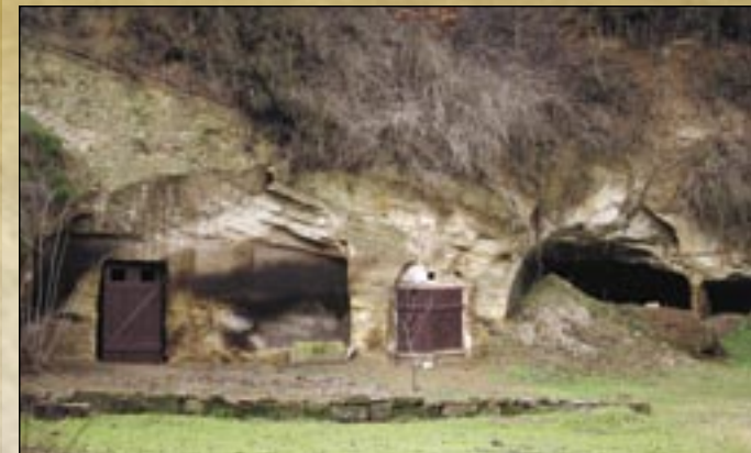
Budynki gospodarcze drążone w skale

Kościół rzymsko-katolicki w stylu barokowym wioski został podniesiony w roku 1757 na szczycie wzgórza pod zamkiem (p.w. Niepokalanego Poczęcia). Zgodnie z corocznym dzięsiątym rejestrzem papieskim z roku 1332 na tym miejscu stała plebania i z tego można przypuszczać, iż kościół też wtedy tutaj był. O tym świadczą kościelne kamienie, które są wbudowane w róg baszty zamku. Przed kościołem