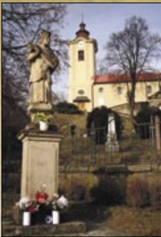
Posąg Świętego Jana Nepomucena

Sírok leży 20 km na zachód od Egeru, na północno-wschodniej granicy gór Mátra, w dolinie przy zbiegnięciu się potoku Tarna (Tarna Parád) i rzeki Tarna (Tarna Cered). Osada była własnością rodu Aba, jego pierwsze wzmianki pochodzą w roku 1302 pod nazwą Sirák. Na granicy dzisiejszej wioski 294 m wysokości nad poziomem morza wznosi się stożek skalny z tufy riolitowej na którym został wybudowany zamek Sírok po najeździe tatarskim. W roku 1426 pod zamkiem już była wioska pod nazwą Sirokalja, w XV wieku dostała podniesioną rangę miasteczka. W roku 1596 po upadku