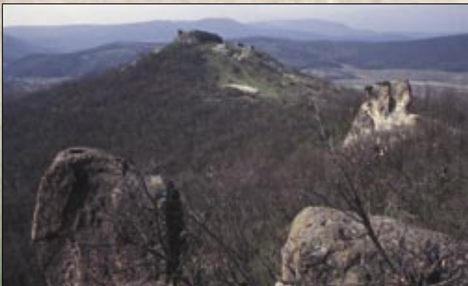
Panorama zamku ze stołu Turka, w środku ze Skalami Mnicha i Zakonnicy

Z dachu zamku dobrze widać jeden rzeźbiony blok tufa dacitowego, który tak wygląda jak blat stołu i nazywają go Stołem Turka