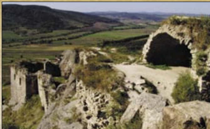
Dwór wewnętrzny zamku

(Törökasztal). Wydrążone w kształcie talerza doły i kanały, dziury mogą wskazywać na ceremonie sakralne węgierskiej religii pierwotnej, która była z okresu Św. Stefana przed przyjęciem chrztu przez państwo węgierskie. Możemy spostrzec dwa samotne kamienie blisko Stołu Turka, któremu język literacki bardzo trafnie dał nazwę Skala Mnich (Barát-szikla) i Skala Zakonnicy (Apáca-szikla) . Te nazwy zwracają uwagę na ich kształt, który uformowała im natura przez tysiącletnią pracę i zwraca też uwagę na wokół nich snującą się legendę: Król Darnó pozostał wierny swojej strasznej przysiędze – według legendy Attila król Hunów podstępem uwiódł żonę króla Darnó dlatego każdy człowiek, który zbliżał się do jego zamku płacił za to śmiercią. Król swoją strzałą strzelił do witezia Bodony, który był zakochany w Tarna córce króla. Tarna natomiast skoczyła przed Bodony i strzała przeniknęła oba serca. Strzała była magiczna i natychmiast zamieniła kochanków w kamienie.