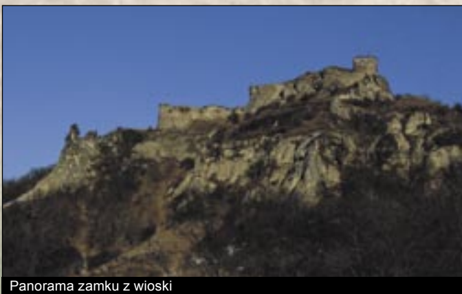
Panorama zamku z wioski

Centrum rekreacyjno-wypoczynkowe Doliny Studni (Kútvölgy) jest doskonałym miejscem do odpoczynku. Miejsce to jest czynne cały rok dla indywidualnych gości. Ciekawostką jest to, że w ostatni koniec tygodnia w lipcu każdego roku organizują tutaj zjazd motocyklistów gdzie przybywa dużo ludzi i z zagranicy.