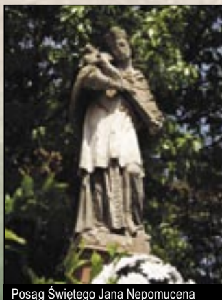
Posąg Świętego Jana Nepomucena

Znajdujący się obok osady zamek Maklyán (inaczej: Maklyán) rodzina Maklyán z Debrő wybudowała prawdopodobnie w drugiej połowie XIII wieku. W roku 1435 już jako ruiny figuruje w dokumentach, a w roku 1590 już tylko jako miejsce zamku. Kapituła egerska kazała przywozić kamienie budowlane do wznoszenia własnych budowli z kopalni kamiennej, która znajdowała się obok zamku. 4 nisze kamiennego ula znajdują się na skalistym grzbiecie Góry Młodej Męzatk (Menyecske-hegy) wznoszącej się na południe od miejsca dawnego zamku, który stał na okrągłej 214 m wysokiej piramidzie kamiennej. Przykładem wykorzystania kamiennego podłoża Gór Bukowych są stajnie owiec drążone w tufie. Ciekawostką jest pozatany stożek skalny z riolitowej tufy zwany Kobieta z kamienia (Kőasszony) albo Dziewczyna z kamienia (Leánykő) , w którym wydrążono kryjówkę. Na południe od „Kobiety z kamienia,„ jest samotny stożek bez niszy, który zwany jest przez miejscową ludność Młody pastuch kamienny (Kőbojtár) . Jeszcze jedna kryjówka Kryjówka Zbójnika (Betyárbújó) ,