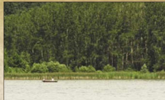
Jeziro Egerszalók, ulubione miejsce wędkarzy

która jest wydrążona w bloku tufy, wznosi się na Starej Górze (Öreg-hegy) i jest dobrze widzialny z drogi na południowej części osady, znajdującej się ponad rzędami piwnic, prowadzącej do Demjénu. Nad wejściem do kryjówki jest jedna nisza kamiennego ula. Na drugiej części wioski, na zboczach pagórków są mieszkania jaskiniowe wykute w tufie riolitowej. Mieszkania jaskiniowe na początku XIX wieku w większości były zamieszkałe przez biedaków. Wyludniły się pod koniec roku 1980, niekiedy jeszcze dzisiaj są używane jako spiżarnie i piwnice winiarskie. Złączone domy jaskiniowe ulicy Sáfrány ładnie harmonizują z widowską formacją turystycznej drogi prowadzącej do gorącego źródła.