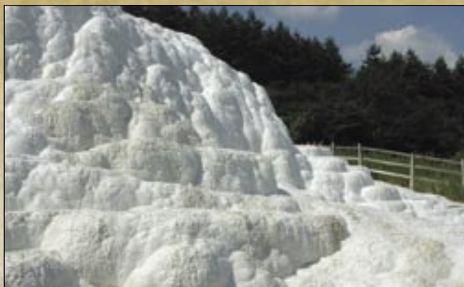
Pagórek z tufy wapiennej przy ciepłym źródle w wiosce Szalók

Znajdujący się obok osady zamek Maklyán (inaczej: Maklyán) rodzina Maklyán z Debrő wybudowała prawdopodobnie w drugiej połowie XIII wieku. W roku 1435 już jako ruiny figuruje w dokumentach, a w roku 1590 już tylko jako miejsce zamku. Kapituła egerska kazała przywozić kamienie budowlane do wznoszenia własnych budowli z kopalni kamiennej, która znajdowała się obok zamku. 4 nisze kamiennego ula znajdują się na skalistym grzbiecie Góry Młodej Męzatk (Menyecske-hegy) wznoszącej się na południe od miejsca dawnego zamku, który stał na okrągłej 214 m wysokiej piramidzie kamiennej. Przykładem wykorzystania kamiennego podłoża Gór Bukowych są stajnie owiec drążone w tufie. Ciekawostką jest pozatany stożek skalny z riolitowej tufy zwany Kobieta z kamienia (Kőasszony) albo Dziewczyna z kamienia (Leánykő) , w którym wydrążono kryjówkę. Na południe od „Kobiety z kamienia,„ jest samotny stożek bez niszy, który zwany jest przez miejscową ludność Młody pastuch kamienny (Kőbojtár) . Jeszcze jedna kryjówka Kryjówka Zbójnika (Betyárbújó) ,