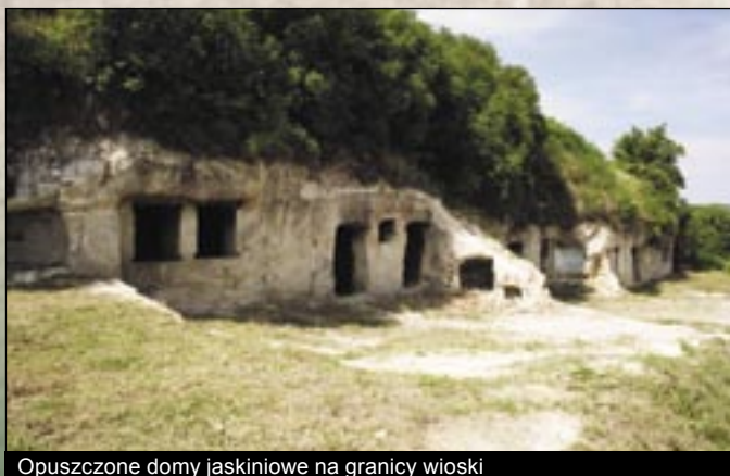
Opuszczone domy jaskiniowe na granicy wioski

i dziesięcinę od chłopów pańszczyźnianych kapituły i od rodzin szlacheckich Belényi'ego i Szalóki'ego, na skutek czego wioska ponownie się wyludniała. W roku 1687 po zdobyciu na powrót Egeru chłopci pańszczyźniany, którzy w Egerszalóku żyli przeprowadzili się do miasta Egeru, które otrzymało rangę wolnego królewskiego miasta, i tam byli zwolnieni od płacenia podatku. Na rozkaz władcy żołnierze wypędzili skupionych na zamku chłopów pańszczyźnianych i z powrotem odprowadzili ich w posiadanie swoich dziedziców. W ten sposób wioska z powrotem odzyskała część ludności około 1694 roku, ale tylko na dziesięć lat dlatego, bo w czasach kuruców od nowa się wyludniła. (Kurucowie to uczestnicy antyfeudalnych i wyzwoleniczych powstań chłopskich na Węgrzech.) Kapituła 35 szwabów i rodzin niemieckich chłopów pańszczyźnianych osiedliła w Szalóku na mocy umowy 4-ego czerwca w roku 1731. Od połowy XVIII wieku węgierscy chłopci pańszczyźniany zaczęli przeprowadzać się tu gromadnie. Ludność wioski stała się dwujęzyczna by z czasem stać się jednojęzyczną węgierską.