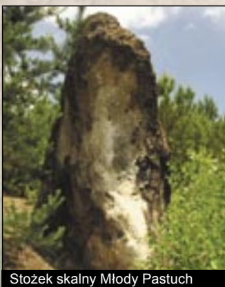
Stożek skalny Młody Pastuch

m. woda o temperaturze 65-68 C° zamieniła osadę Egerszalók w międzynarodowe kąpielisko termalne o właściwościach leczniczych. Spływająca po zboczu wzgórza woda stworzyła pagórek tufy wapiennej. Dzięki temu osada jest zwana „węgierskim Pamukkale”, na wzór słynnych na całym świecie tureckich kąpielisk. Od roku 2007 przyjmuje gości w wybudowanym nieporównanym naturalnym środowisku kompleksie wellnes „Kąpielisko Lecznicze i Kąpielisko Wellnes” („Gyógy és Wellnesfürdő”).