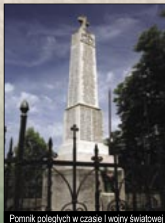
Pomnik poległych w czasie I wojny światowej