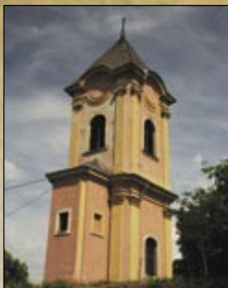
Wieża w stylu barokowym z dzwonem w wiosce Szalók

Egerszalók leży 6 km na zachód od Egeru i jest położony między górami Mátra i Bükk, w dolinie potoku Laskó. Osada jest zaludniona już od założenia państwa, był w odwiecznym posiadaniu rodu Szalók. Pierwsze pisemne odnotowania pochodzą z roku 1248, gdzie Egerszalók występuje pod nazwą „terra-Zolouk”. Na początku XVI wieku większa część Egerszalók weszła w posiadanie kapituły Egeru. Podczas oblężenia Egeru w roku 1552 Turcy go zniszczyli, ale wkrótce zaczął się zaludniać. W roku 1586 Turcy zaczęli ściągac wysokie podatki