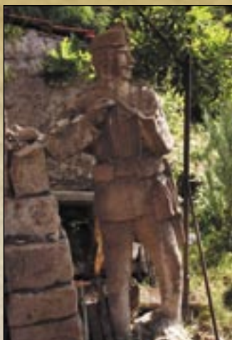
Postać węgierskiego szeregowca piechoty