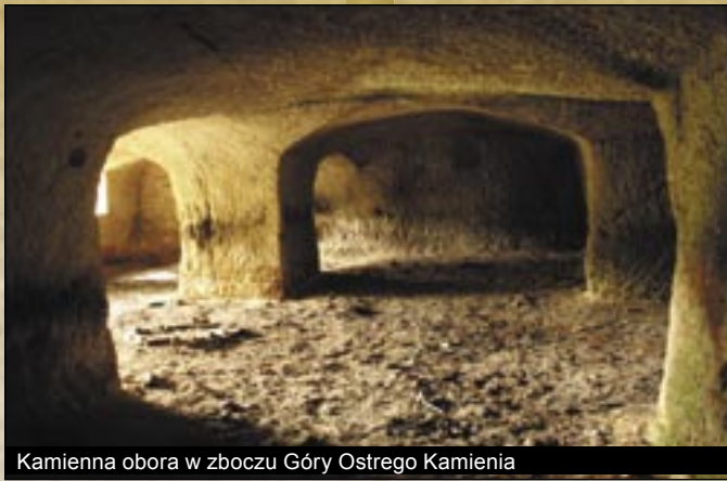
Kamienna obora w zboczu Góry Ostrego Kamienia

Od niepamiętnych czasów kamień był materiałem budowlanym domów mieszkalnych w Demjénie. W pierwszych dziesięcioleciach XVIII wieku biskup-ziemianin zainicjował wydobywanie dobrego, zdatnego do budowy tufu riolitowego, znajdującego się u podnóża Góry Winogrona (Szőlő-hegy) (kamieniołom Nagyeresztvény) w celu budowy posiadłości. Posągi barokowego Egeru zostały wyrzeźbione z kamieni