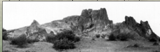
Ostry Kamień (Hegyes-kő) w roku 1971

Na zewnątrz Pustelni (Remete-lak) możemy zobaczyć ślady 6 niszzy (kamienie ule doliny Pustelnika). Od tej grupy kamiennych uli pokazniejsze jest urwisko Kontur Kopalni-Szczyt Kamienny (Bánya-él-Kő-