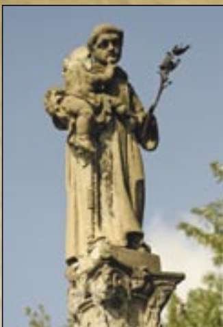
Św. Antoni z Padwy