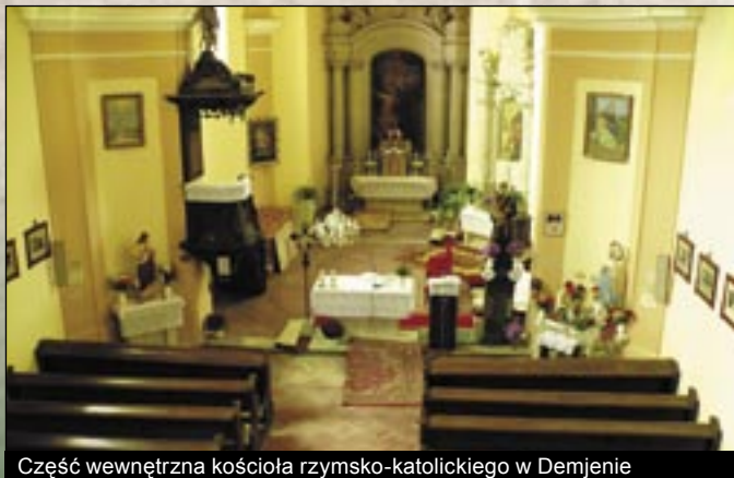
Część wewnętrzna kościoła rzymsko-katolickiego w Demjénie

Demjén już w roku 1363 miał kościół w Prywatnym Archiwum Kapituły Egerskiej zwanym kościołem Św. Antoniego. Dalsze losy kościoła nie są znane, mógł zostać zniszczony przez husytów albo w czasach tureckich, w każdym razie spis parafii w roku 1696 już o nim nie wspomina. Budowa obecnego kościoła rzym-