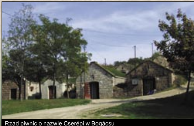
Rząd piwnic o nazwie Cserépi w Bogácsu

W latach 1950 w osadzie poszukiwano ropy naftowej, której nie znaleźli ale w czasie próbnych wierceń wydobyła się 70 C° woda z gorącego źródła, na którego wykorzystanie już w roku 1959 został wybudowany basen kąpielowy. Obok łaźni gorącego źródła, która przede wszystkim ma działanie lecznicze na choroby wewnętrzne i choroby stawów został wybudowany ośrodek