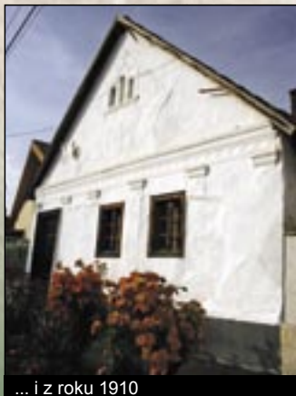
... i z roku 1910