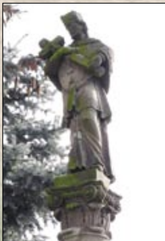
Posąg Świętego Jana Nepomucena

Punkt informacyjny pod nazwą „Bukkaljai Kő-út” (Droga Kamienia u podnóża Gór Bukowych) – Eger, w Fellner-tömbbelső (w podwórzu bloku Fellner)