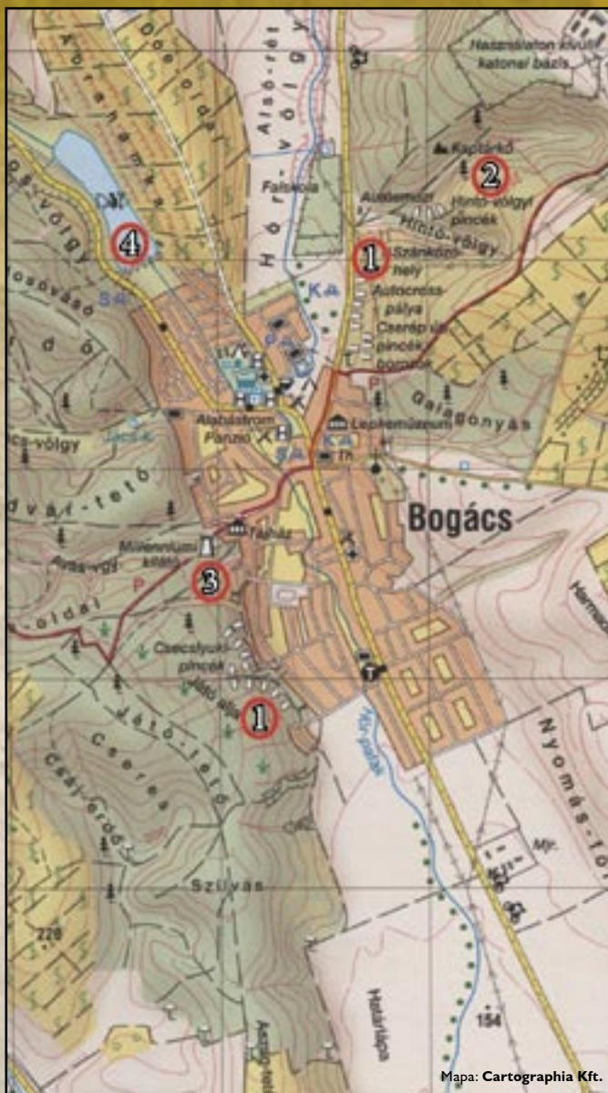
Mapa: Cartographia Kft.

Urząd Burmistrza; Adres: Bogács, Alkotmány út 9. Tel.: +36 49/534-400 • www.bogacs.hu