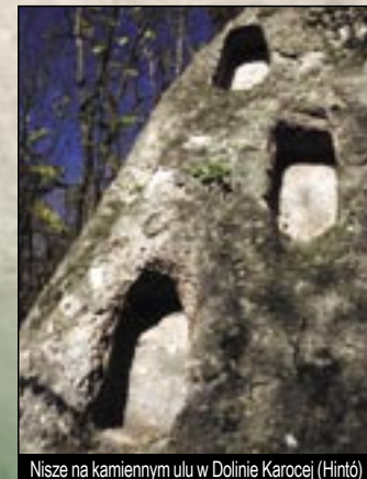
Nisze na kamiennym ulu w Dolinie Karocej (Hintó)

Bogács jest centrum Prowincji Winnej podnóże Gór Bukowych (Bukkaljai Borvidék). Osada może być dumna z trzech rzędów piwnic. Najbardziej znany jest rząd piwnic Cserép, ale również godne są uwagi rzędy piwnic w Csec-lyuk i w Dolinie Karocej (Hintó). W Dolinie Karocej (Hintó) nieda-