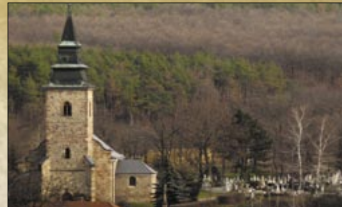
Widok z wioski

zdrowotno- rekreacyjny. W otoczeniu Łaźni Gorącego Źródła Bogács podczas kilku dziesiątek lat rozwinął się znaczny obszar wypoczynkowy z hotelami i pensjonatami. Wioska mimo tego zachowała swoisty urok.