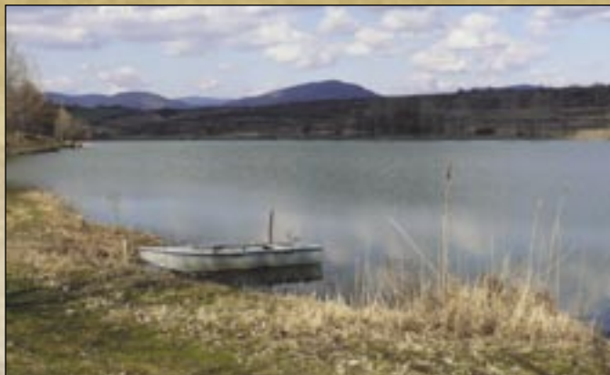
Jezioro Bogács lubiane miejsce przed wędkarzy

Wszystkich Świętych. Dane pochodzące z roku 1724 wspominały, że patronem kościoła już był Święty Marcin. W latach 1800-1801 remontowali kościół, dach kryli gontami a wewnątrz całkowicie przemienili. Wówczas kościół już miał organy i stała chrzcielnicę z posągami Świętego Jana Chrzciciela. Stojący obok kościoła posąg Świętego Jana Nepomucena był wykonany w roku 1824. W roku 1901 kościół znowu był remontowany i wtedy dostał się do kościoła obraz ołtarzowy przedstawiający Świętego Marcina.