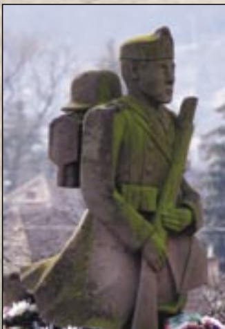
Pomnik z I. Wojny Światowej

Paręset metrów od kąpieliska powstały przez przegrodzenie potoku Szoros sztuczny zalew – jezioro Bogács dziś jest rajem dla wędkarzy. Jezioro dostarcza przyjemnej rekreacji nie tylko wędkarzom, ale i wczasowiczom.