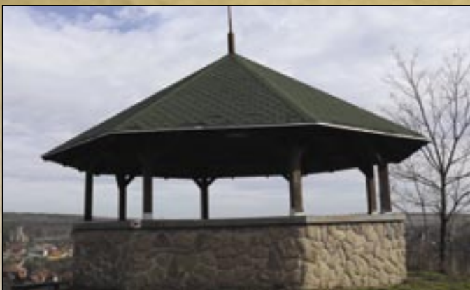
Wieża obserwacyjna Milenium

leko od piwnic znajduje się jeden kamienny ul z pięcioma niszami.