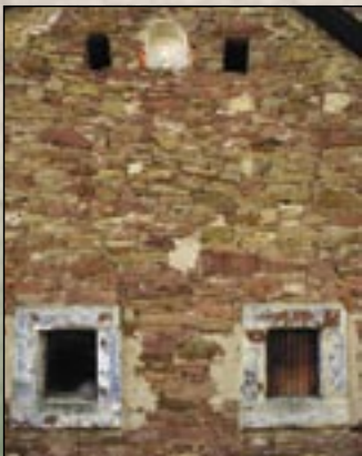
Front domu z kładzionego kamienia z XIX wieku

Na osadzie znajdujący się pod ochroną konserwatora zabytków kościół rzymsko-katolicki (p.w. Św. Marcina) wybudowano z wydobytego w okolicy z czerwonego koloru kamienia (tuf dacytowy) na fundamencie starszego kościoła, który pochodził z XIII wieku wzniesionego na cześć Świętego Jerzego. Dokładny czas jego budowy jest nieznan. 3. maja w roku 1568 dla egerskiej kapituły był sporządzony inwentarz, który wspominał, że nawet wtedy patronem kościoła też był Św. Jerzy. Wtedy obok głównego ołtarza miał dwa boczne ołtarze, jeden na cześć Świętego Mihała a drugi na cześć