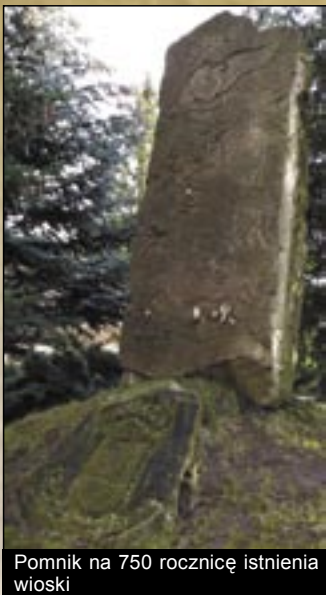
Pomnik na 750 rocznicę istnienia wioski

B ogács leży 17 km na wschód od Egeru gdzie spotykają się doliny potoku Hór i potoku Szoros. Obszar ten był już zamieszkały od czasów prehistorycznych. Na granicy wioski w pierwszej połowie XX wieku odkryto osadę epoki miedzi i brązu, skąd wydobyto bardzo niezwykle bogate materiały wykopaliskowe. Pierwsze wzmianki o wiosce pochodzą z roku 1248 pod nazwa Bagach. Wtedy już stał w wiosce kościół postawiony na cześć Świętego Jerzego. Wioska będąca wtedy majątkiem szlachty na początku XVI wieku przechodzi do majątku egerskiej kapituły. Za czasów tureckich wioska uległa zniszczeniu i dopiero w XVIII wieku od nowa się zaludniła.