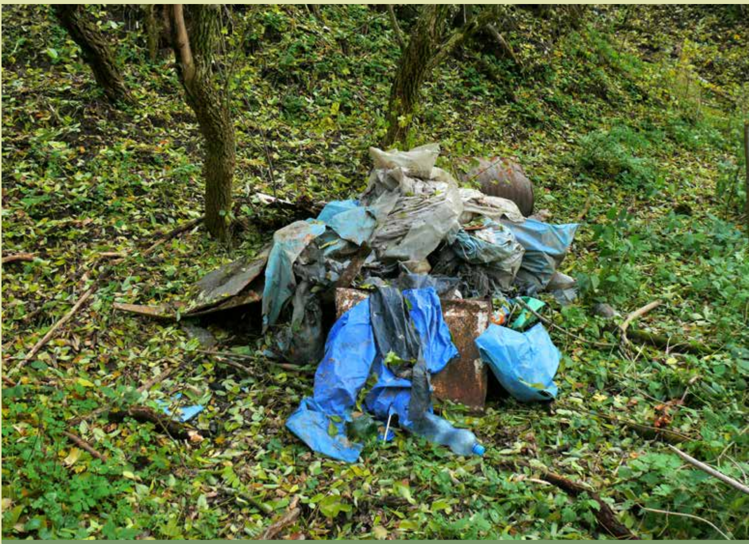
Egyik hulladékgyűjtő akció eredménye

Az emberi lét egyik legáltalánosabb kísérő jelensége a hulladék képződése. A használhatatlanná, szükségtelenné vált anyagokat az emberiség eddigi története során egyszerűen visszajuttatta az őt körülvevő természeti környezetbe. Azonban a tudományos-technikai forradalom során bekövetkezett termelésbővülés, az újabb és újabb – elsősorban szintetikus – anyagok megjelenése a hulladékok közvetlen visszajuttatását a természeti környezetbe fokozatosan tarthatatlanná tette. A ma már egyre inkább létünket fenyegető környezetkárosodás jelentős része a hulladékokból származik, amelyeket nehezen vagy egyáltalán nem dolgoz fel a természetes anyagcsere körfolyamat.