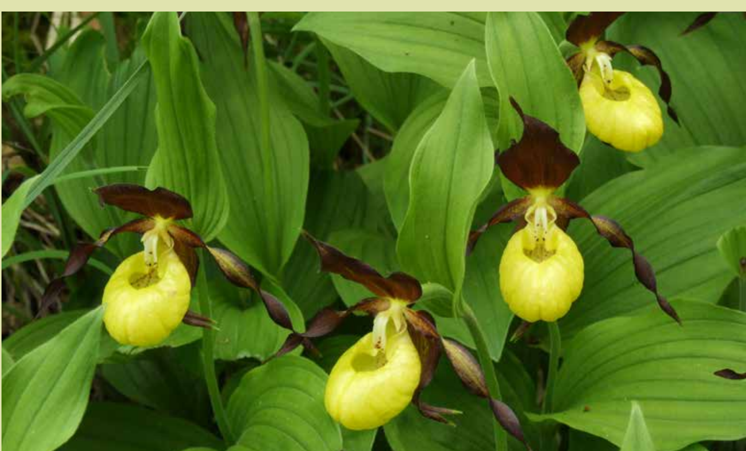
A Boldogasszony papucsja (rigópohár) az egyik legjelentősebb természetvédelmi értéket képviselő orchidea a Bükk Nemzeti Parkban

1976. december 28.-án jelent meg a Tanácsok Közlönyében a határozat a Bükk Nemzeti Park létesítéséről, és 1977. január 1-én 38774,6 ha-os védett területtel megalakult hazánk sorrendben harmadik nemzeti park-