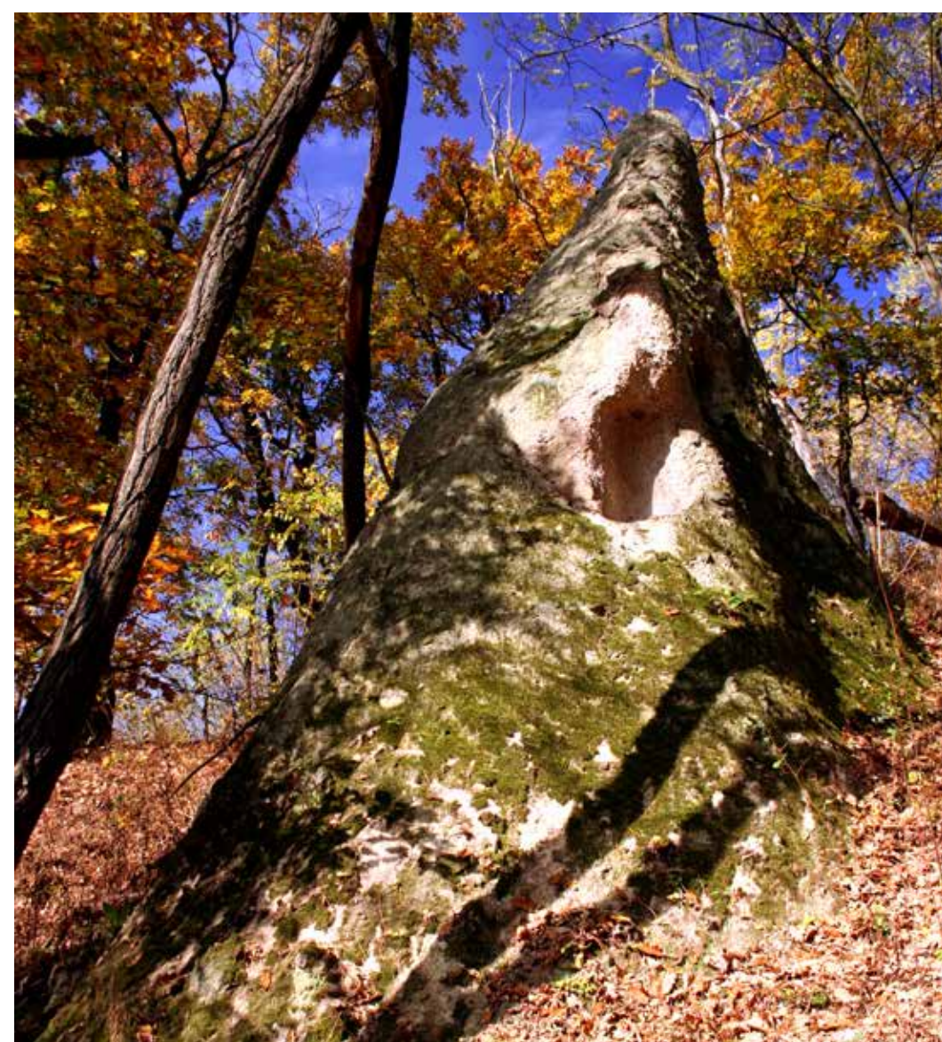
Sziklakúp a Csordás-völgyben