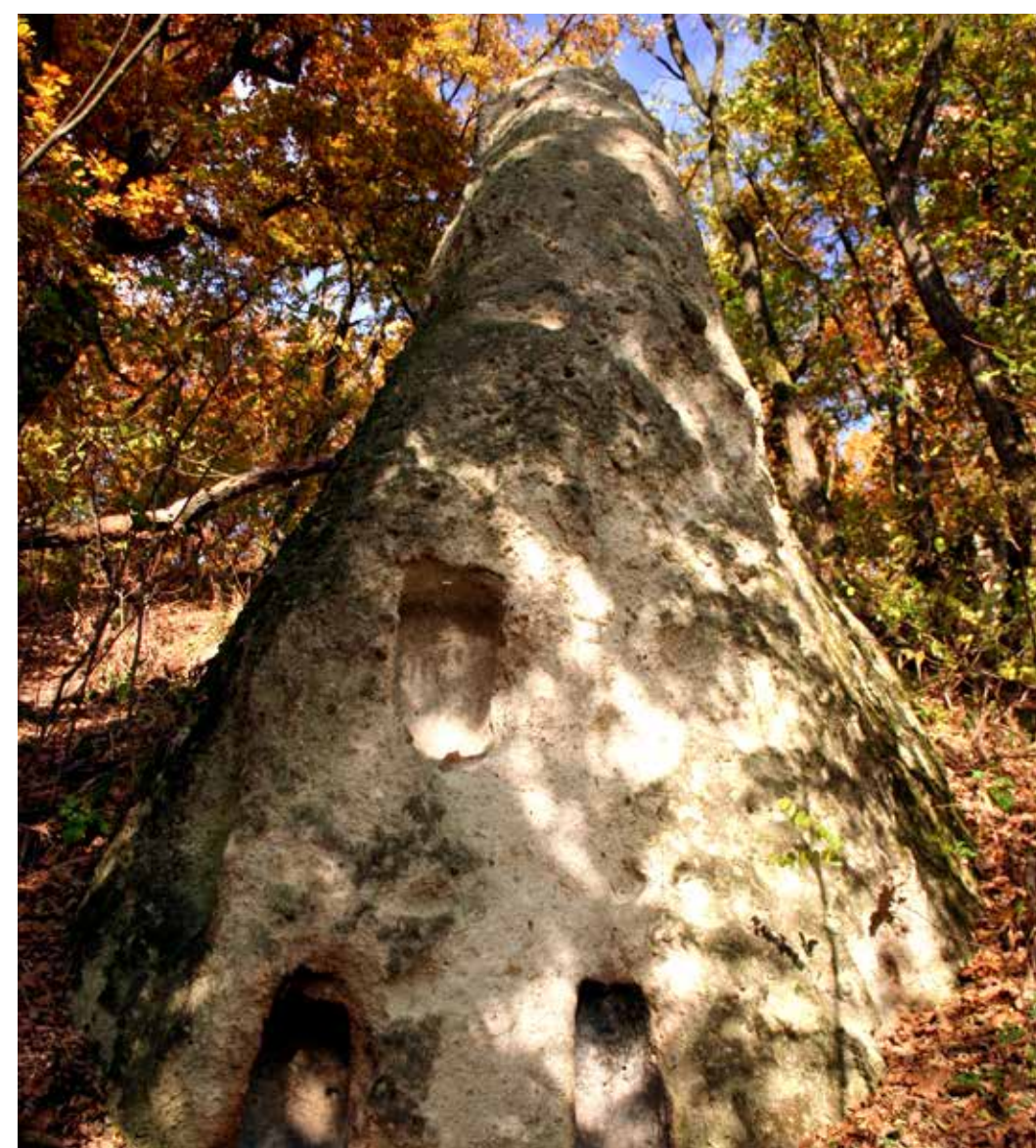
Kaptárkő a Furgál-völgyben

A Kő-völgy Felső-szoros nevű részének bejáratától keletre a Szaszudka nevű hegytető déli lejtőjén bújik meg a Koldustaszító kaptárköve. Az alacsony tufapad délkeleti oldalába 6 fülkét faragtak.