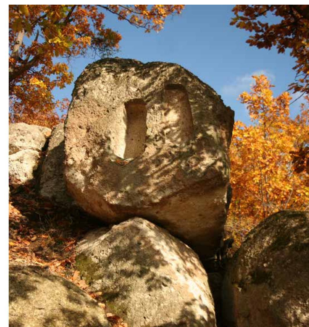
Fülkés ingókövek a Karud oldalában