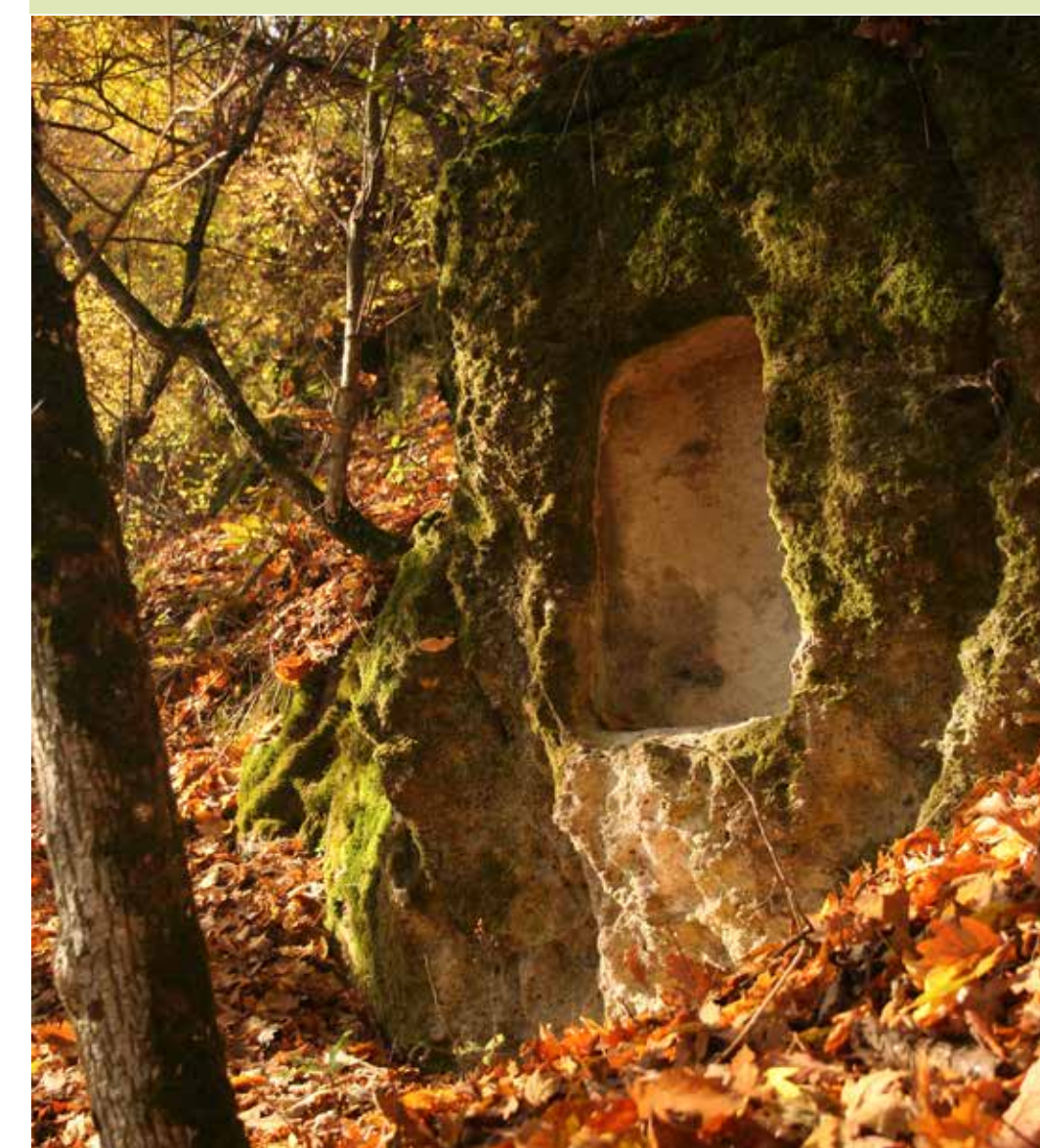
Fülke a Vén-hegyen