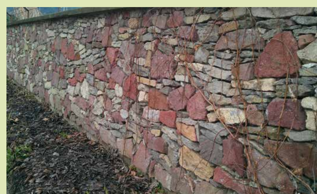
Szárazon rakott kőfal

megmunkálás, a kőbányászat és kőfaragás eszközeit.