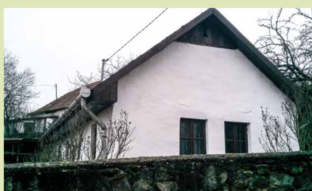
Tájház a Szomolyai úton

A település keleti végén, a temetődombon magasodik látványos kőhomlokzatával a Szent Márton templom. A helyben bányászott vörös kőből – dácittufából – épült műemléki vé-