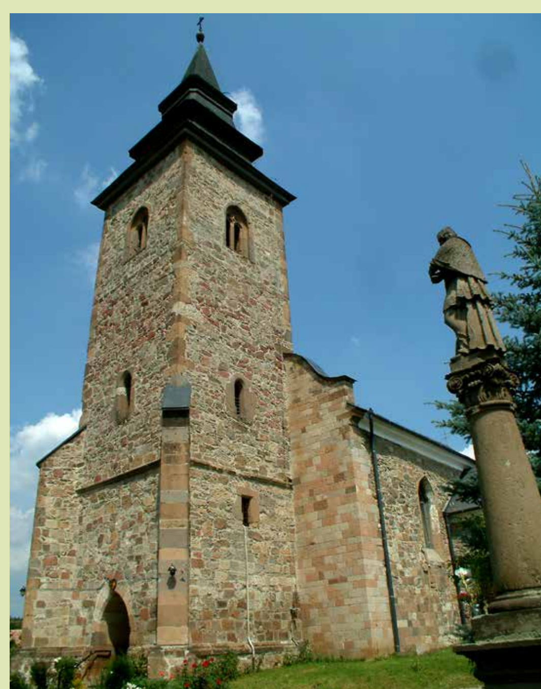
A falu középkori temploma

A Szomolyai út végén található kilátóból csodás panoráma nyílik a Bükkalja hullámzó dombvonulataira.