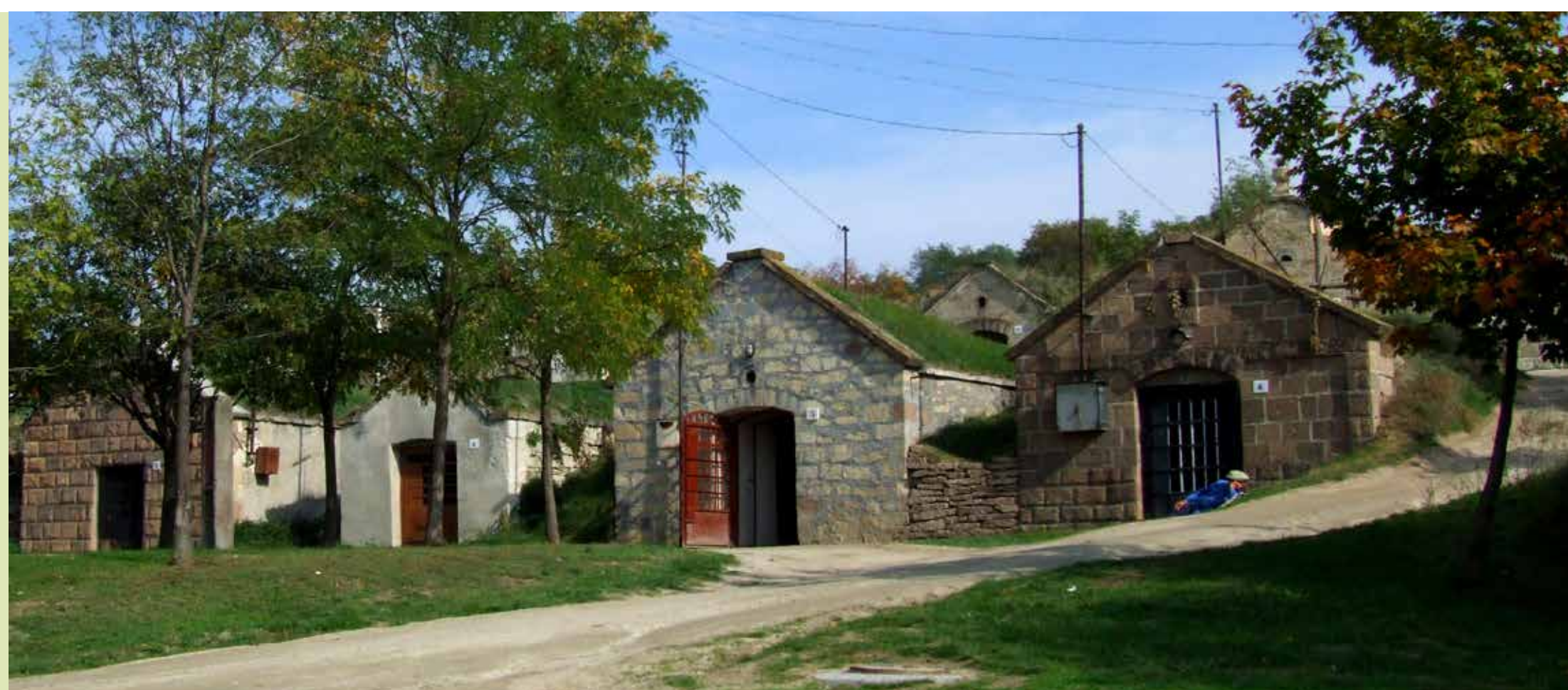
A híres Cserép úti pincesor

A legismertebb a fürdőhöz közeli Cserép úti pincesor, tőle északra található a Hintó-völgyben a Bagolyvári-pincesor, valamint a település dél-nyugati határában a Csecslyuki-pincesor.